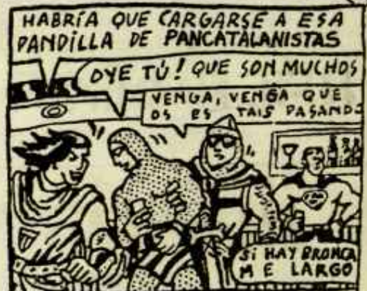
La Comisió Negosiadora

La Congregasió de Pías Marías Redentoras de Plenarios a formulát una enèrchica protèsta degút a ke en el proyèkte de hastatút no se fa ninguna rreferènsia a la patrona hofisiál.