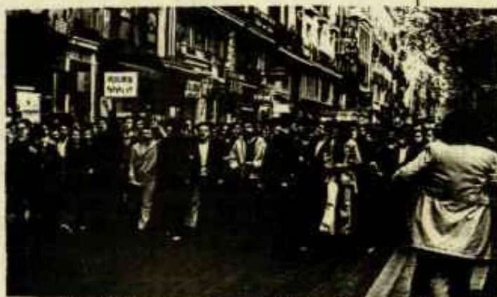
MANIFESTATION DE LA SEAT A BARCELONE.

Dans des conditions normales les ouvriers n'auraient pas pu manifester devant la prison, mais ceci est dû à l'agitation profonde de la classe ouvrière de Barcelone.