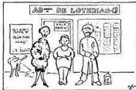
La propietaria de l'administració on feu comprar el billet dels nostres cartones que han estat favoreixuts per la sort. L'acompanyen el sereno i la noia de la llet.