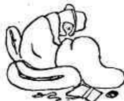
D'estar per casa