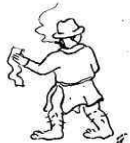
Vestit de nit