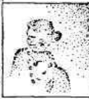
Còpia d'un retrat, que s'extremava al tercer rebobai de la victima. Podem admirar el seu somriure beblis.

Modestament el cronista hi ha dit la seva; perdeneu-le si ha mostrat ignorància: no no pot més que fer us d'un dret el dret d'opinar. Si hem només pogué parlar del què exten no podríem dir mai res!