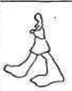
Projecte de la figura que parà el Mestre Modestini.

L'art de figurar com el seu nom indica es l'art de fer figures. Així sembla que ho creu, també, cert personalage que segons diu ell és l'unic que hi entén. I què és una figura? És l'expressió d'un ritme articulat. L'acord proporcionat entre els peus d'una figura i el cap si en té, entre els braços i la boca.