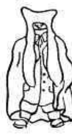
Model especialíssim de tarda