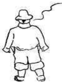
Vestit de carrer

CREACIONS D'HIVERN DEL DANDY DE LA VIA GÒTICA