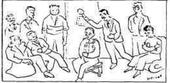
La concurrència almorçant l'ortulisme.

ron a l'altura de les circumstàncies. Particularment cal destacar els mots pronunciats pel nou confrare Secretari de la Casa del Poble: "No hi ha dubte, ara que juquem amb cartes, viscos, si per aconseguir la finalitat que tots em proposem complim amb nos com assents (parelles abusives a l'ensenyà de l'Ordre) no hi ha dubte que aconseguirem tot allò que em proposem. Nois moltes