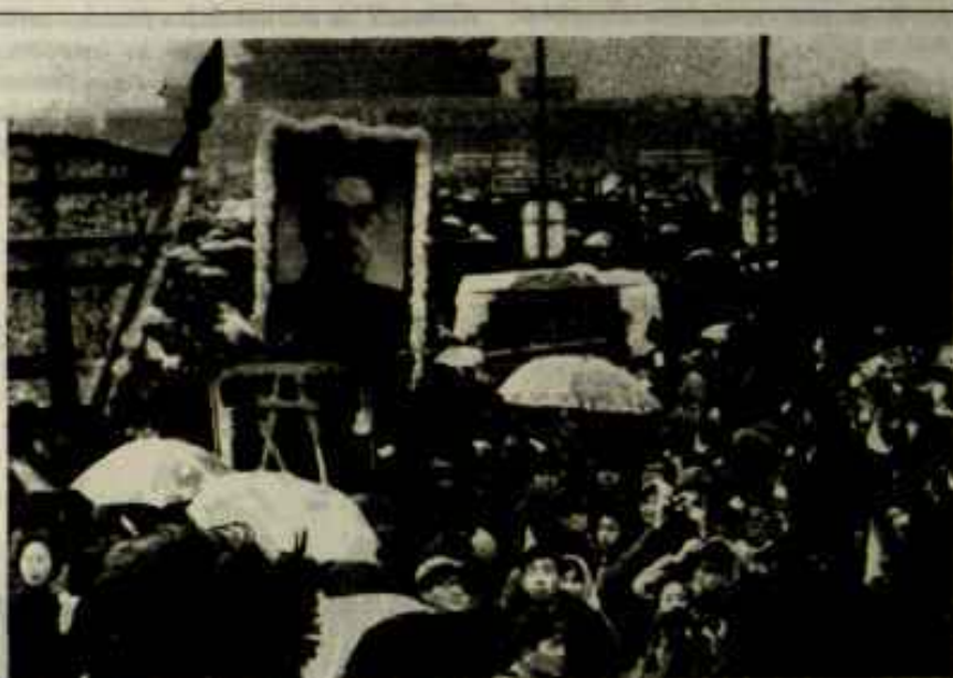
5 de Abril en Tien An Men

A la hora de la salida del trabajo [el sábado es día de trabajo en China], este tema apareció en las consignas pintadas en caracteres de un metro de alto en las vallas de la plaza Tien An Men [colocadas alrededor del lugar designado para la construcción del mausoleo de Mao]. Cuando se cerraron las fábricas y las oficinas la multitud se volvió extremadamente densa en todo el centro de la ciudad, y probablemente alcanzó los varios cientos de miles de personas, de los cuales un