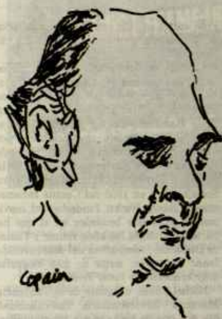
José López Portillo

López Portillo está tratando de quedar bien con Estados Unidos a todos los niveles. Por eso, de los cientos de invitados que asistieron a la toma de posesión de