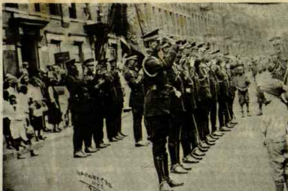
Seguidores de Garvey

Creo que debido al inaudito retraso político y teórico, y al inaudito nivel económico, el despertar de la clase obrera ocurrirá muy rápidamente. Es posible entonces que los negros se conviertan en la sección más avanzada. Tenemos ya un ejemplo similar en Rusia. Los rusos eran los negros europeos. Es muy posible que también los negros lleguen a la dictadura del proletariado en un par de gigantescas zancadas, adelante del gran bloque de los trabajadores blancos. Entonces ellos proporcionarán la vanguardia. Estoy seguro que de todas maneras ellos combatirán mejor que los trabajadores blancos. Eso, sin embargo, sólo puede ocurrir a condición de que un partido comunista lleve a cabo una lucha sin compromiso y sin misericordia, no contra los supuestos