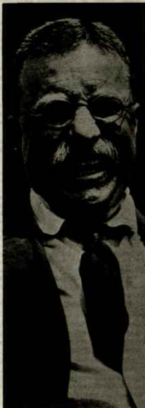
T. ROOSEVELT: Gentil, pero con un "Gran Garrote" en la cintura.

El Tratado Clayton-Bulwer que Washington negoció con Londres en 1850, estipulaba que ninguna de las dos potencias establecería el control exclusivo sobre el canal transoceánico que pudiera ser construido. Más aún, los firmantes prometían la protección conjunta de tales instalaciones haciéndolas accesibles a todas las potencias que respetaran este acuerdo.