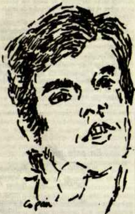
GONZALEZ: Obtuvo Amplia Votación.

depende de una mayoría en el parlamento. Hasta que una nueva constitución no sea adoptada, Suárez sólo es responsable ante el rey. Su gobierno, naturalmente, tiene asegurada una mayoría en el senado, donde las áreas conservadoras recibieron una representación aún más desproporcionada y donde 41 miembros son directamente nombrados por el rey.