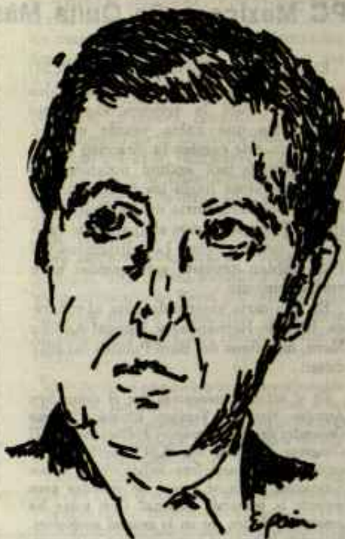
SUÁREZ: Preocupado por Victoria Estrecha.

elecciones se lleven a cabo bajo condiciones normales, evitar que sean desbaratadas por los enemigos de la renovación democrática, que tratan de desestabilizar la situación en el país por medio de acciones terroristas.