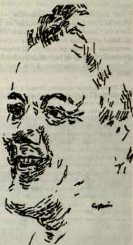
TORRIJOS: Aliado útil de la Casa Blanca

Hasta 1962 era prohibido para los ciudadanos panameños ser trabajadores postales o bomberos en el enclave. Y están en efecto, excluidos de otras varias categorías de trabajo.