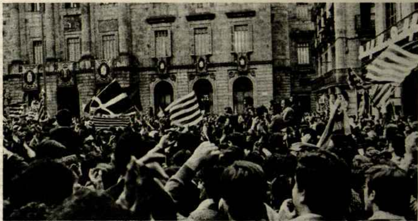
Cuadernos para el Diálogo

Durante la primera campaña electoral desde la Guerra Civil, los pueblos de las naciones oprimidas se manifestaban por todas partes exigiendo autonomía.