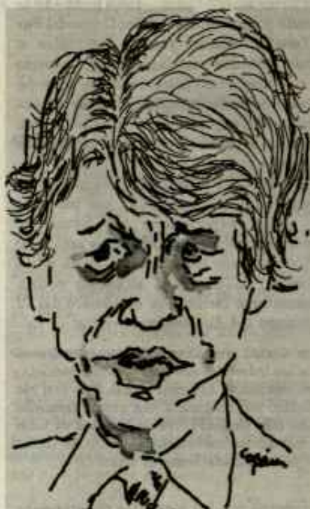
Carter imprime una sonrisa a su política hipócrita.

mica y el Desarrollo, en la que están incluidas todas las potencias imperialistas. La U.S. Steel Corporation y otros grandes productores esperan que estas charlas resultarán en un acuerdo restringiendo las