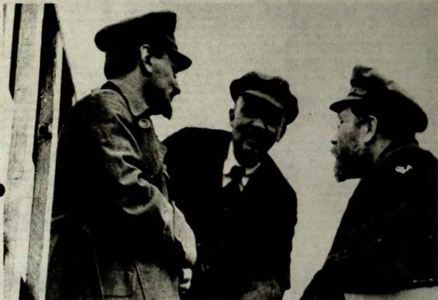
Trotsky, Lenin y Kámenev discutiendo durante las sesiones del Segundo Congreso de la III Internacional Comunista en 1919.

partido fuertemente centralizado no hubiésemos tomado el poder. El centralismo significa concentrar el máximo esfuerzo organizativo en la 'meta'. Es la única manera de dirigir a millones de personas en combate contra las clases poseedoras.