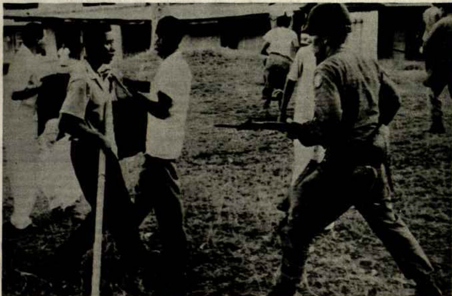
PANAMA, Noviembre de 1959: Tropas norteamericanas impiden implantar bandera panameña en Zona del Canal.