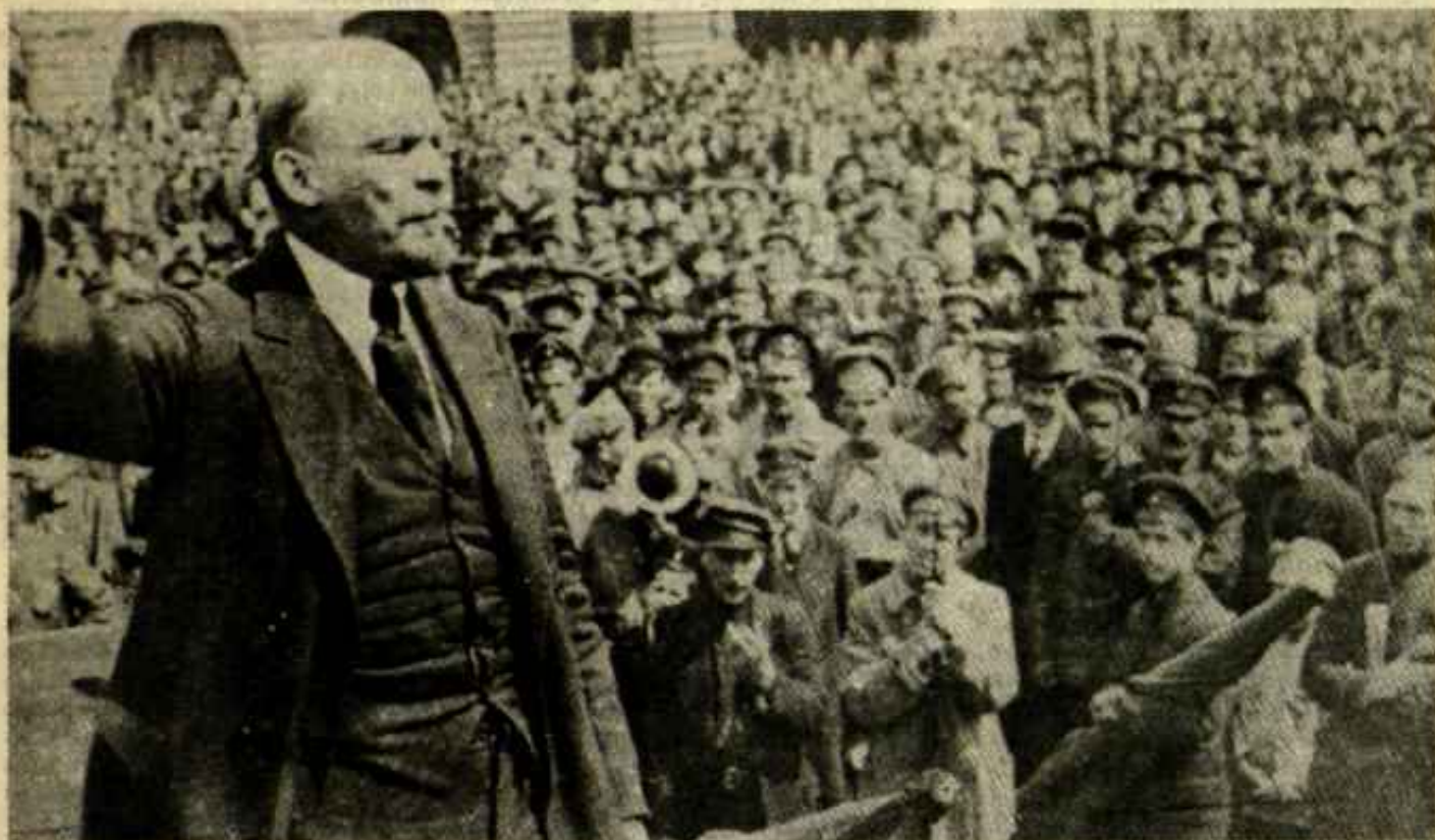
Lenin, abril de 1917.

[El siguiente es el primero de dos artículos publicados en los números del 2 y 9 de noviembre de 1977 del semanario Combate , órgano del Comité Central de la Liga Comunista Revolucionaria, organización española simpatizante de la Cuarta Internacional.]