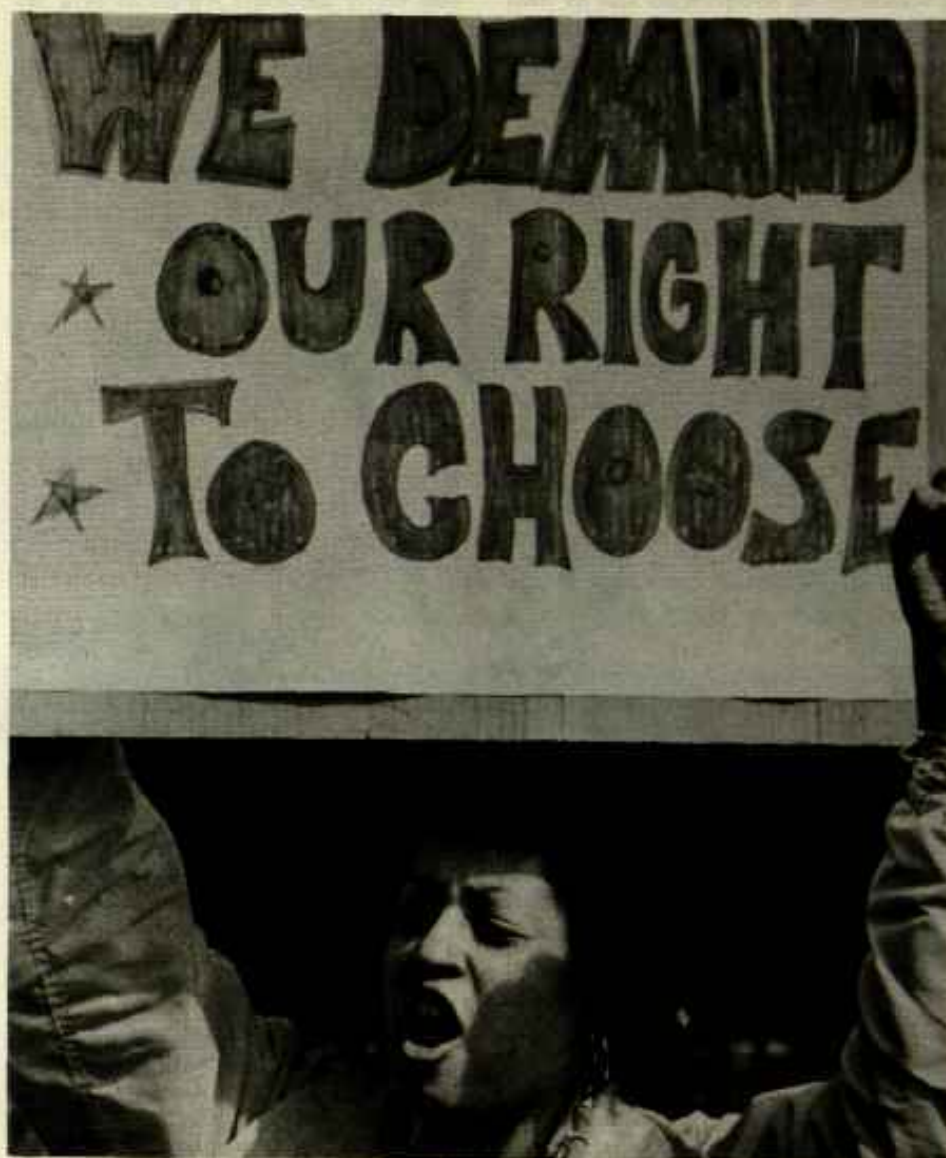
¡Exigimos el derecho a escoger!

[El siguiente artículo fue tomado de la edición del 25 de noviembre del semanario socialista revolucionario norteamericano The Militant . La traducción es de Perspectiva Mundial .]