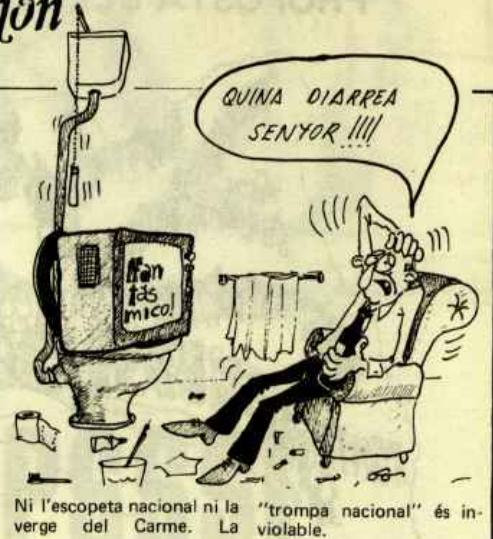
Ni l'escopeta nacional ni la verge del Carme. La "tropa nacional" és inviolable.

El més gruixut s'esdevindrà, però, si s'atreveixen a tocar el vi. Aquí sí que no valdran punyetes.