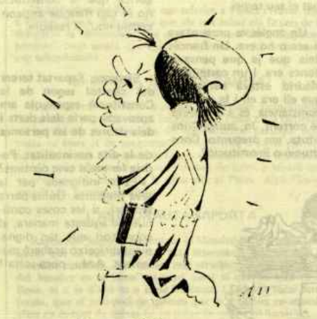
(31 gener 1978) 1.133 esmenes es varen presentar i el Felipe diu que vol ser republicà.