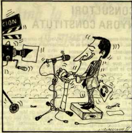
L'onze de juliol de l'any passat Suárez la Constitució ha anunciat.