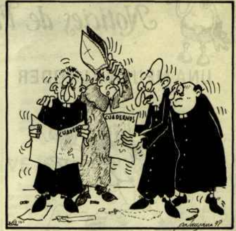
(26-26 novembre 1977) La premsa filtra l'esborrany i l'Església té un desengany.