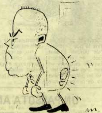
(12 Maig 1978) S'aproven les "nacionalitats" i ja tenim els d'A.P. empenyats.