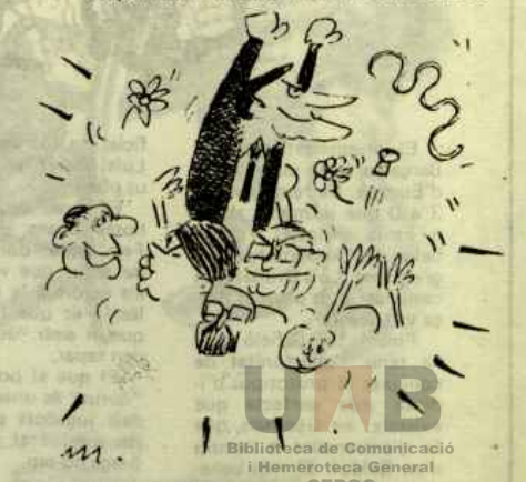
(31 Agost 1978) "Juntos pero no revueltos", com diuen per allà, Senat i Congrés la Constitució varen aprovar.