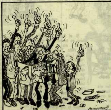
(9 Agost al 5 Octubre 1978) Al Senat la Constitució passa de pressa perquè l'aprovació a tots interessa.