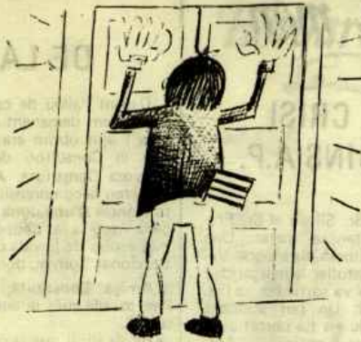
(22 Agost 1977) La Ponència Constitucional s'ha trobat i pels morros la porta ens ha tancat.