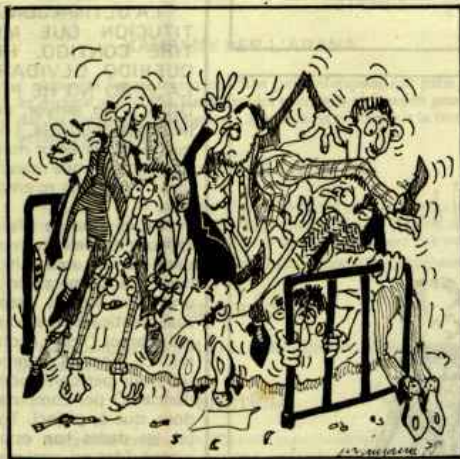
(23 maig 1978) De sobte el consens ha començat i 27 articles de cop s'han aprovat.