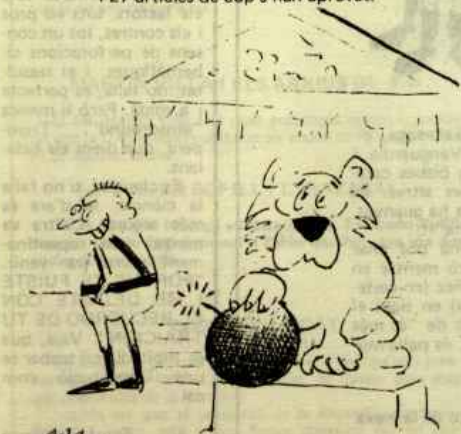
(21 Juliol 1978) El Congrés la Constitució ha aprovat malgrat les bombes que han esclatat.