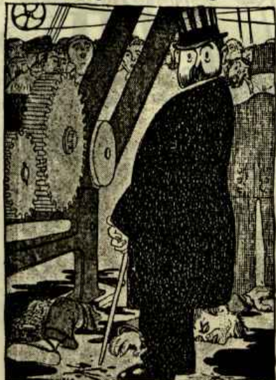
—Té: la divisió del treball.