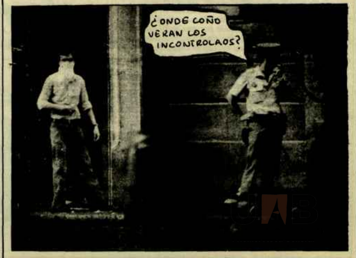
Mecató Fugat i Fugit

EDICIONS "LA PIPA D'EN ROC" N. Reg. Emp. Edit. 1963/78 Apartat de Correus, n. 52 Mataró ISBN 84-85539-01-X ISBN 84-85539-00-1 (OC) Dip. Leg. B-34.263-1978 Fotocomposició: Copisteria La Juliana-dr. farrero, 6 (Argentona) Imprimeix: Impremta Mas, Gnal. Mola, 76 (Mataró) Equip Redactor: Toni Albert, Pere Artigas, Francesc Costa, Josep M. Fàbregas, Jaume Graupera. Dibuxants: Josep Novellas i Artur Palomer.