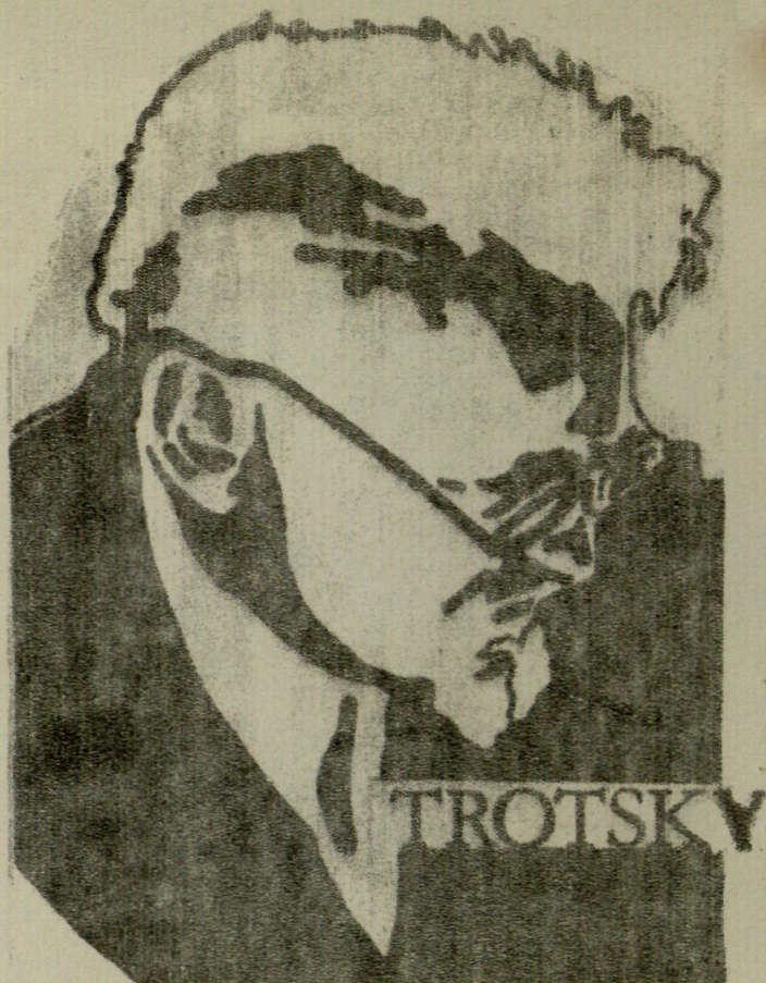
León Trotsky: "En defensa del terrorismo"; en "Dictadura versus democracia", Moscú, 1922.

"Pero, en éste caso, ¿en qué difiere vuestra táctica de las tácticas del zarismo?", nos preguntan los pontífices del liberalismo y del kautskismo. ¿No lo entendéis, santos varones? Vamos a explicároslo. El terror del zarismo iba dirigido --contra el proletariado. La policía zarista degollaba a los trabajadores que luchaban por el orden socialista... Nuestros comités especiales fusilan a terratenientes, capitalistas, generales que están esforzándose por restaurar el orden capitalista. ¿Captáis este...distingo? ¿Sí?... Para nosotros, los comunistas, es más que suficiente."