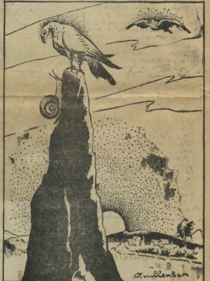
EL AGUILA: —¿Cómo conseguiste llegar? EL CARACOL: —¿A fuerza de arrastrarme.

... que las verticales en el espacio trazadas por dos plomadas, por ejemplo, no sean paralelas entre sí. Para serlo deberían no encontrarse al prolongarlas en sus dos direcciones, lo que no ocurre así, ya que prolongadas hacia la tierra se encontrarían en el centro de la misma, por ser la dirección de la plomada la de un radio terrestre. Las direcciones de dos plomadas distantes entre ellas 3333 kms., forman un ángulo de un grado, y si se distan 33333 kms., son perpendiculares y por lo tanto forman un ángulo de 90°. Los muros de un edificio que decimos ser paralelos, no lo son si siguen la dirección de la plomada, como así ocurre. REFUGIADISMO.