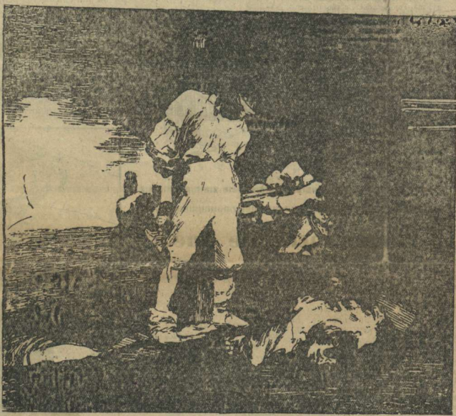
La España de los fusilamientos, tan actual ahora

Este es el primero de una serie de reportajes que iremos publicando en números próximos, relatando pormenores de la vida española tal y como la ve nuestro corresponsal en España.—N. DE LA R.