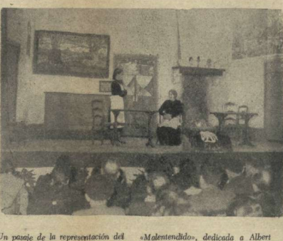
Un pasaje de la representación del "Malentendido", dedicada a Albert Camus por el Grupo Juvenil.

Desde las columnas de RUTA, saludamos entusiásticamente la aparición de este vócher interno de la Juventud, invitándole a proseguir adelante.