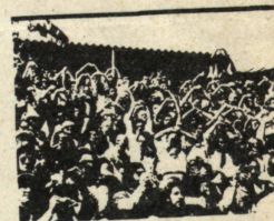
Han pasado ya más de dos años desde la muerte del dictador

La F.L. de Sta. Coloma de Gramanet de la F.I.J.L. comunica a todos los compañeros la suspensión temporal de La Revista Anarquica, debido a problemas económicos y a la necesidad que tiene la organización de editar un órgano fuerte y con una salida regular, para lo cual nuestra F.L. aporta los medios económicos antes destinados a La R.A. así como toda clase de apoyo humano y material; esperamos no obstante poder publicar otra vez en un tiempo no muy lejano dicha revista. Hasta entonces. Salud y Anarquía.