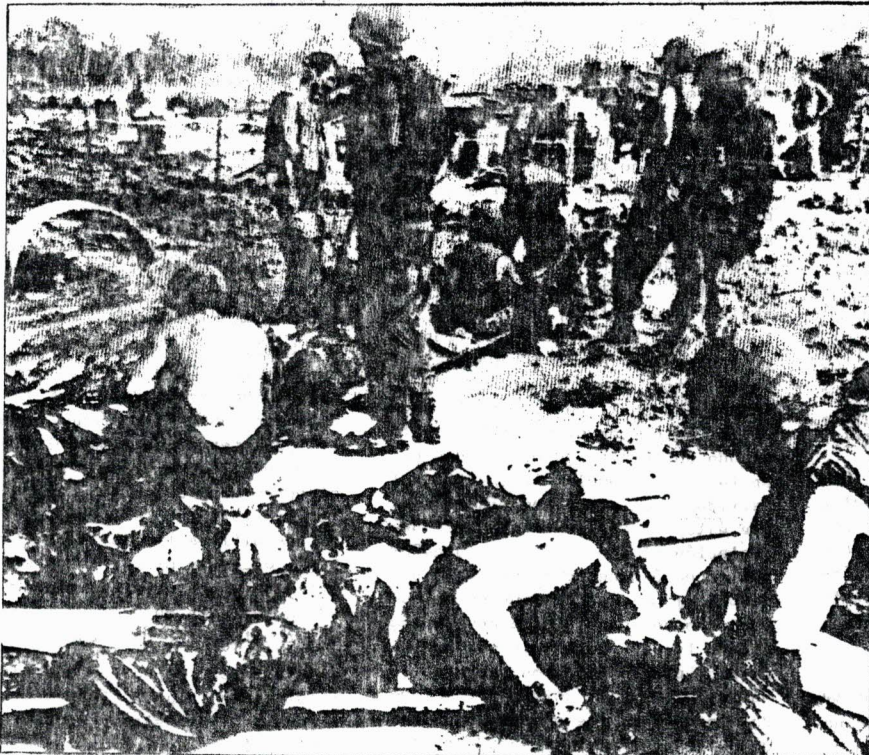
Las derrotas del imperialismo yanqui le obligan a cambiar de táctica

Estos son los cinco principios de la coexistencia pacífica, de la coexistencia pacífica tal como la planteamos los marxistas-leninistas. Otra cosa muy diferente es la "coexistencia pacífica" de la que hablan los social-imperialistas soviéticos. Esta "coexistencia" consiste en colaborar con el imperialismo yanqui para impedir que los pueblos hagan la revolución; en predicar a los