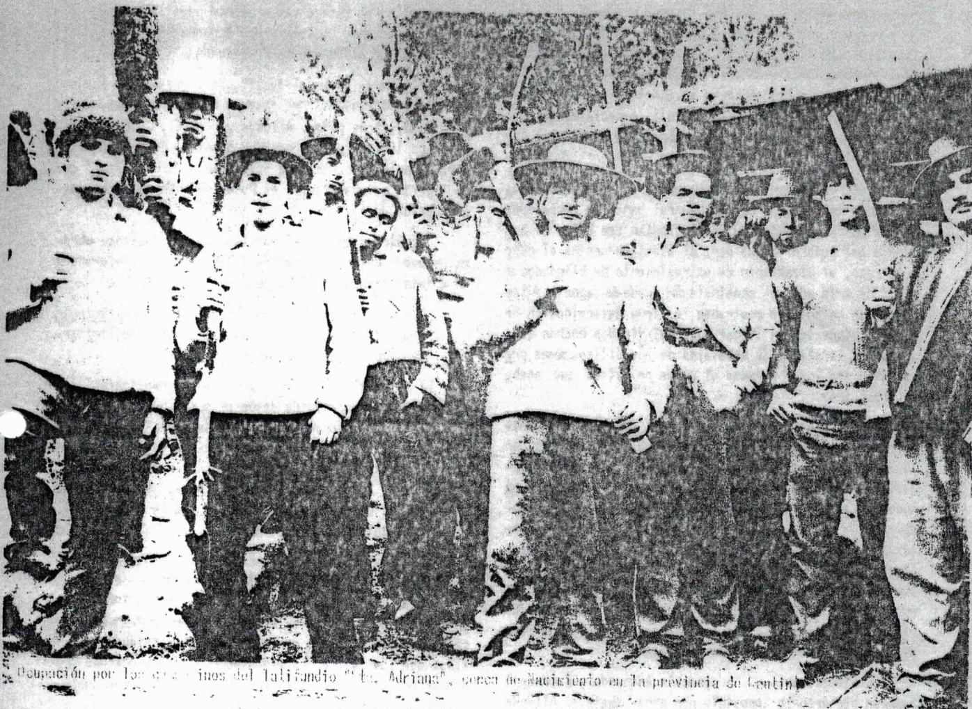
Ocupación por los obreros del latifundio "La Adriana", cerca de Maculí en la provincia de Antofagasta

principal dirigente revisionista al poco de la elección de Allende- implica, y algunos lo sugieren, la formación inmediata de milicias populares. En la situación actual, esto equivaldría a un desafío hacia el Ejército. Sin embargo, el Ejército no es un cuerpo impermeable a los vientos nuevos que soplan en América Latina (...), no es un cuerpo extraño a la nación, al servicio de intereses antinacionales." (2)