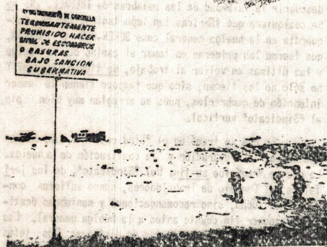
Según decían, en este terreno harían un campo de deportes...

Después de haber pagado, venía la primera de las decepciones: la fecha de entrega se aplazaba uno y otro mes. Y no fue la última jugada. Una vez dentro del piso, había que mover Roma con Santiago para conseguir la luz y el agua. Lo primero te lo daban, con suerte, un mes después de hacer la solicitud. En cuanto al agua, tardaron varios meses y, mientras tanto, había que ir a las obras a buscarla con cubos.