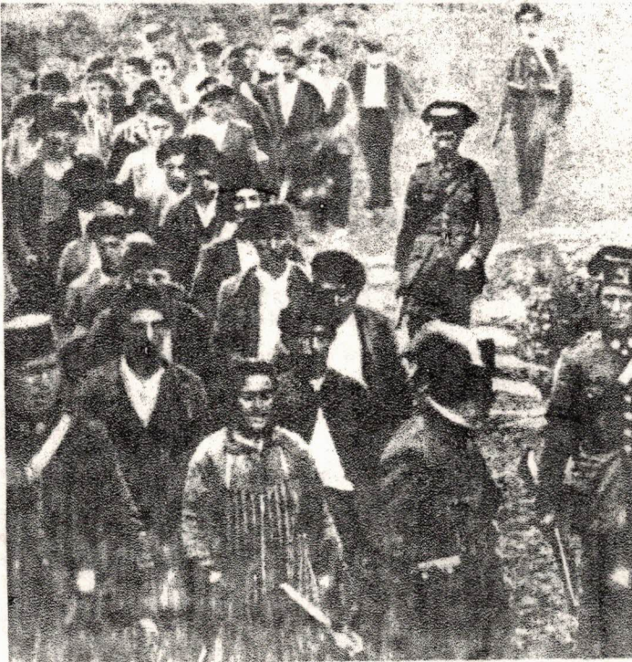
Detenidos en Pola de Lena

Ya hemos visto lo ocurrido en Asturias este día. En el resto de España, sin embargo, el movimiento tuvo una profundidad mucho menor. La huelga general fue una realidad en toda España. Y en no pocos lugares, las masas se echaron a la calle, empuñaron las armas y se enfrentaron valientemente a las fuerzas de represión. Pero la insurrección no