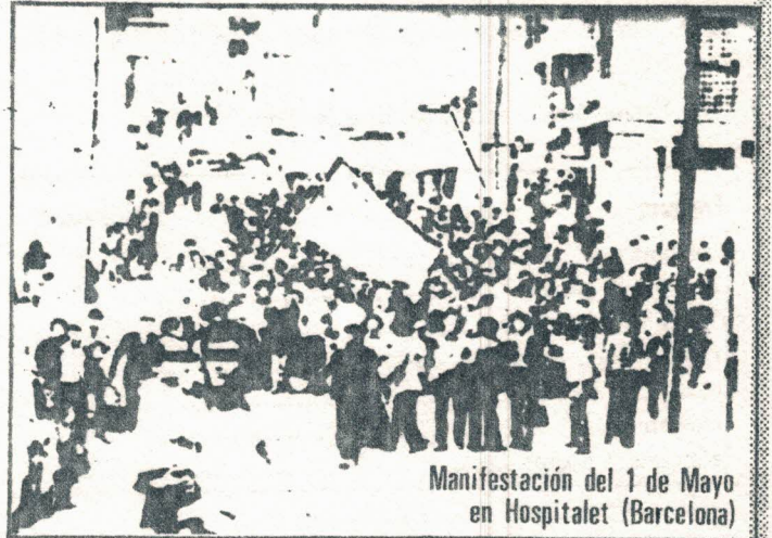
Manifestación del 1 de Mayo en Hospitalet (Barcelona)

Con motivo de la desaparición de Carrero, el gallinero franquista da la impresión de estar menos alborotado. Es lógico que unos y otros —los partidarios del embellecimiento y los que no ven esta necesidad— se hayan dicho: ahora no está el horno para bollos, dejémosnos