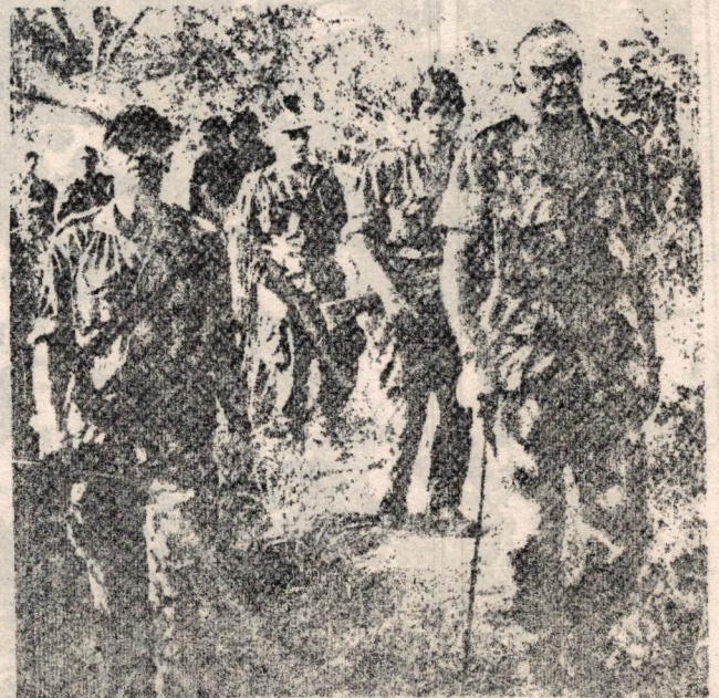
Spínola: una vida al servicio del colonialismo portugués

Los deseos de los sectores más realistas de la gran burguesía, de los imperialistas occidentales y de los militares en favor de poner fin a unas guerras que no podían ganar han confluído con los deseos de paz de los soldados