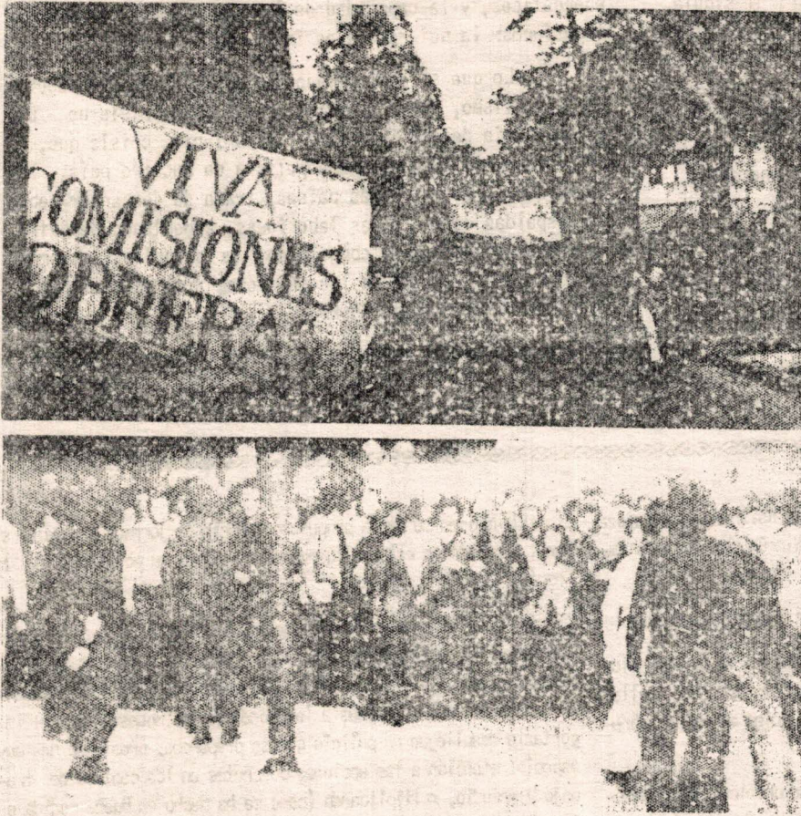
Manifestación del día 30 en Escorial

es lo primero que destaca: lo bien organizada que está. Las consignas las gritamos todos a una, y con mucha fuerza. Parece como si saliesen de una sola garganta. La dispersión se hace sin ningún problema".