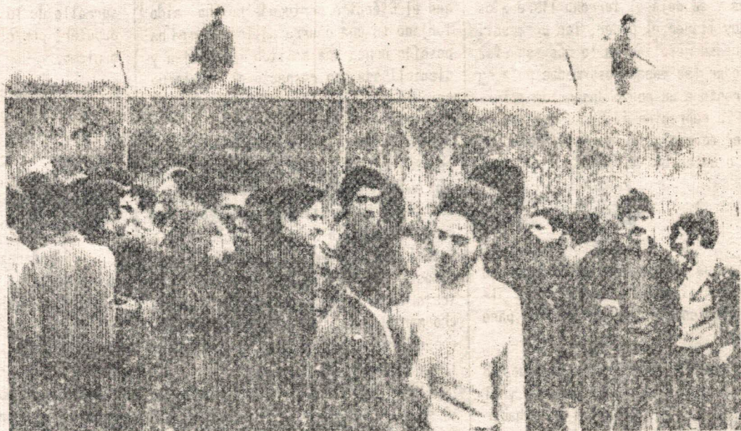
Con los presos políticos recién liberados

y de las amplias masas. Los propósitos de la clase en el poder de renovar, de blanquear un Régimen absolutamente impopular han convergido con las ansias de democracia del pueblo.