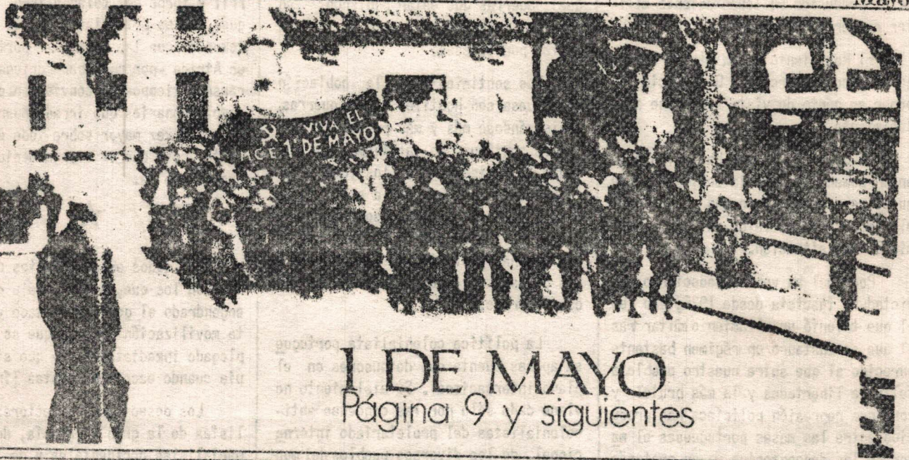
1º de Mayo en Irún (Guipúzcoa)