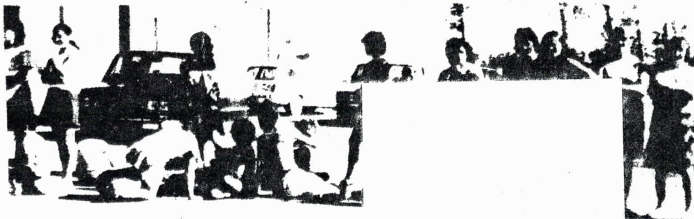
LAS LUCHAS DE MASAS EN LOS BARRIOS POPULARES HAN SIDO CONTINUAS. ARRIBA: MANIFESTACION DE LOS VECINOS DE ORCASITAS (MADRID). A LA IZQUIERDA: MUJERES Y NIÑOS DE EL PRAT (BARCELONA) INTERRUMPEN EL TRAFICO COMO PROTESTA POR LA FALTA DE ESCUELAS