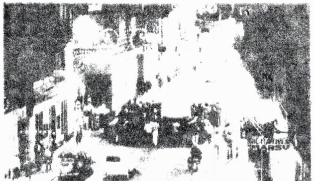
ZARAGOZA. 3 DE OCTUBRE DE 1974. MANIFESTACION EN SOLIDARIDAD CON LOS PRESOS POLITICOS

Las movilizaciones de las que hemos hablado brevemente constituyen un escollo para la política del estafador y verdugo Arias. El y los que están detrás de él quisieran verse las con un pueblo sumiso, amaestrado por unos líderes reformistas y que presentara unas reivindicaciones particularmente moderadas. Pero lo que encuentran es un pueblo ca-