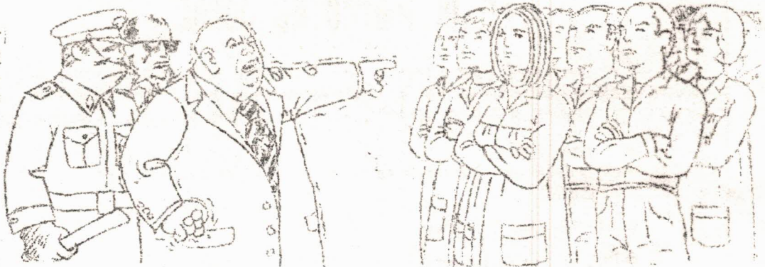
(DIBUJO PUBLICADO EN «VILLVERDE OBRERO»)

Los obreros de CITESA-ITT iniciaron su lucha a comienzos de Noviembre del año pasado. Era éste su primer combate. Las reivindicaciones que presentaron eran prácticamente las que nacieron en la huelga de la Standard, adoptadas luego por las Comisiones Obreras del Metal de Madrid.