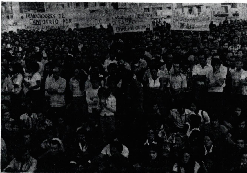
El pueblo trabajador debe cortar por lo sano con los intentos de hacerle pagar los platos rotos del capitalismo. (En la foto, Asamblea de CC.OO. en Burgos).

El interés que el Gobierno tiene en esta medida se centra en el rebajamiento de la capacidad de consumo popular, en el descenso de las rentas salariales (sabida es la falsedad del índice oficial del coste de la vida, muy infe-