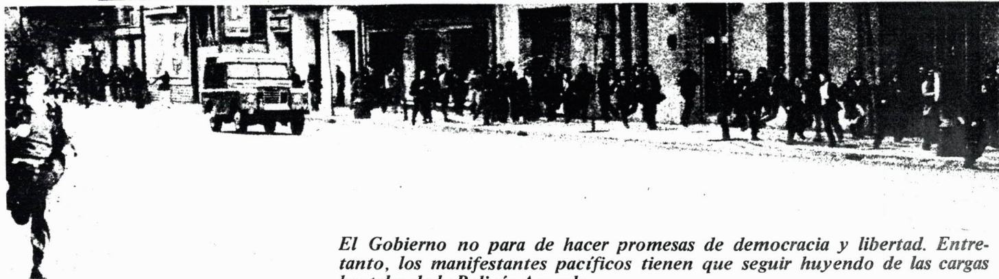
El Gobierno no para de hacer promesas de democracia y libertad. Entretanto, los manifestantes pacíficos tienen que seguir huyendo de las cargas brutales de la Policía Armada.

Es necesario explicar a todos, por todas partes, lo que significa la participación en el referendun. ¡Volquemos nuestros esfuerzos en mostrar la necesidad urgente de la abstención! La abstención de una parte decisiva del pueblo en una farsa como ésta servirá para cortarles las alas, facilitando la marcha hacia una democracia sin trampas y sin recortes, a la democracia y la libertad para todos a que aspiramos.