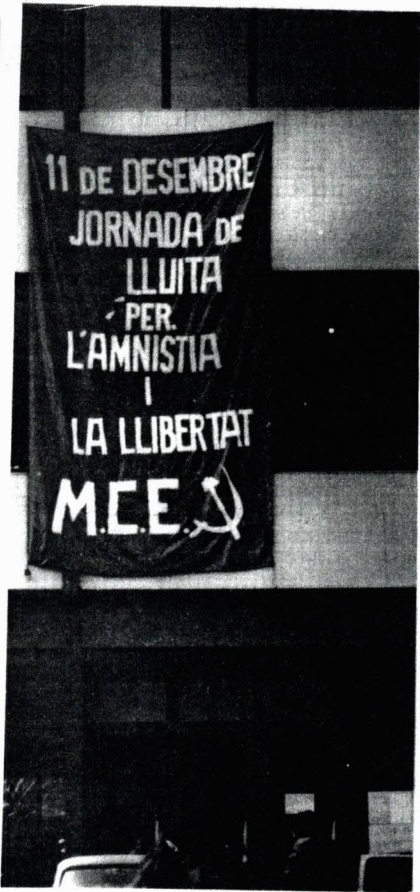
Con la misma autoridad deben actuar las asociaciones de barrio o los estudiantes.

Diremos más: además de imponer la presencia de una vida democrática que el Gobierno y las leyes niegan, es necesario ponerse en la perspectiva de suplir al Gobierno, de actuar con autoridad, tomando las medidas democráticas que el Gobierno rechaza. En este sentido pensamos que los trabajadores han de ir organizando ya el paso a un sindicalismo obrero democrático, independiente de la patronal y el Estado, preparándose para convocar y realizar en su día, si es preciso, unas elecciones libres de abajo a arriba.