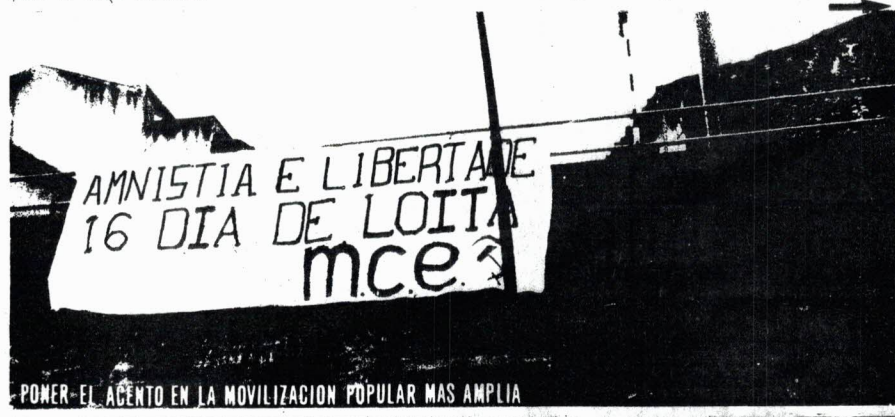
PONER EL ACENTO EN LA MOVILIZACION POPULAR MAS AMPLIA