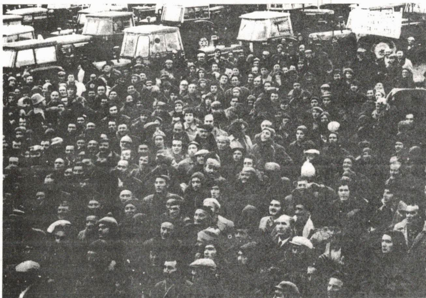
Las autonomías regionales han de permitir la búsqueda de soluciones ajustadas a sus problemas propios. (En la foto, un aspecto de la reciente “guerra del maíz” aragonesa).

Nos animan a ello, asimismo, razones de orden más inmediato. Estimamos que los pueblos de España están hoy interesados en desplazar lo más posible los centros de decisión —políticos, económicos, culturales...— desde “las alturas” hacia la base, desde el