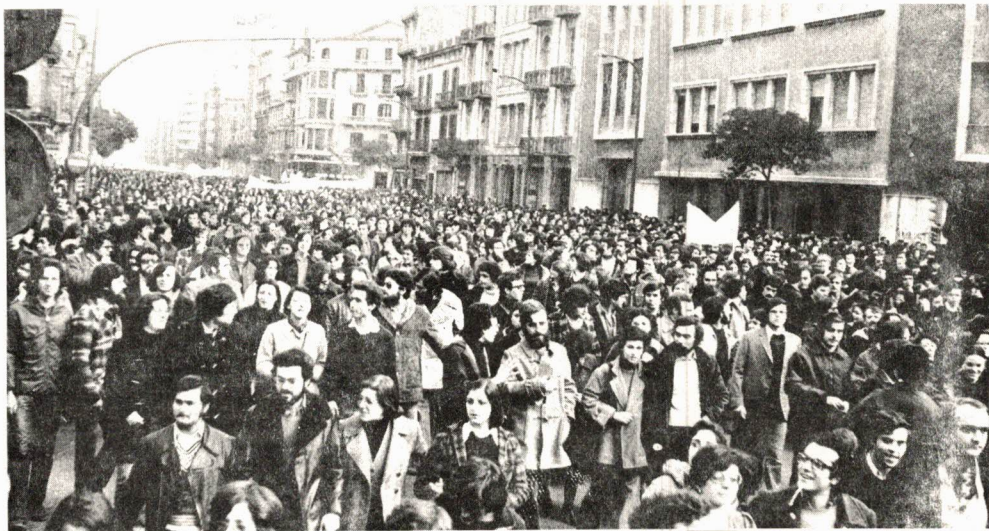
Los organismos unitarios fomentan el acercamiento entre las bases militantes de los distintos partidos y organizaciones, cosa muy positiva.

(*) Algunos compañeros se preguntan si nuestra presencia en COORDINACION DEMOCRATICA no nos impone ningún compromiso que nos lleve a rebajar nuestro esfuerzo en pro de la movilización popular. Debemos aclarar que no existe ningún compromiso en este sentido y que nuestra libertad de acción, como la de los demás Partidos de COORDINACION DEMOCRATICA, es total.