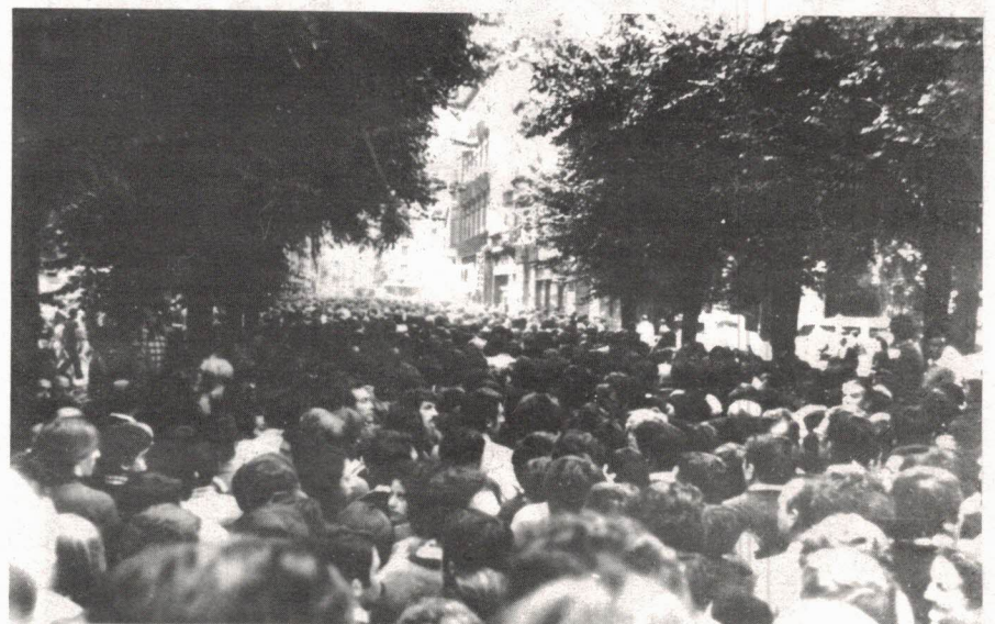
El pueblo de Guipúzcoa dió una respuesta ejemplar, movilizándose en la calle.