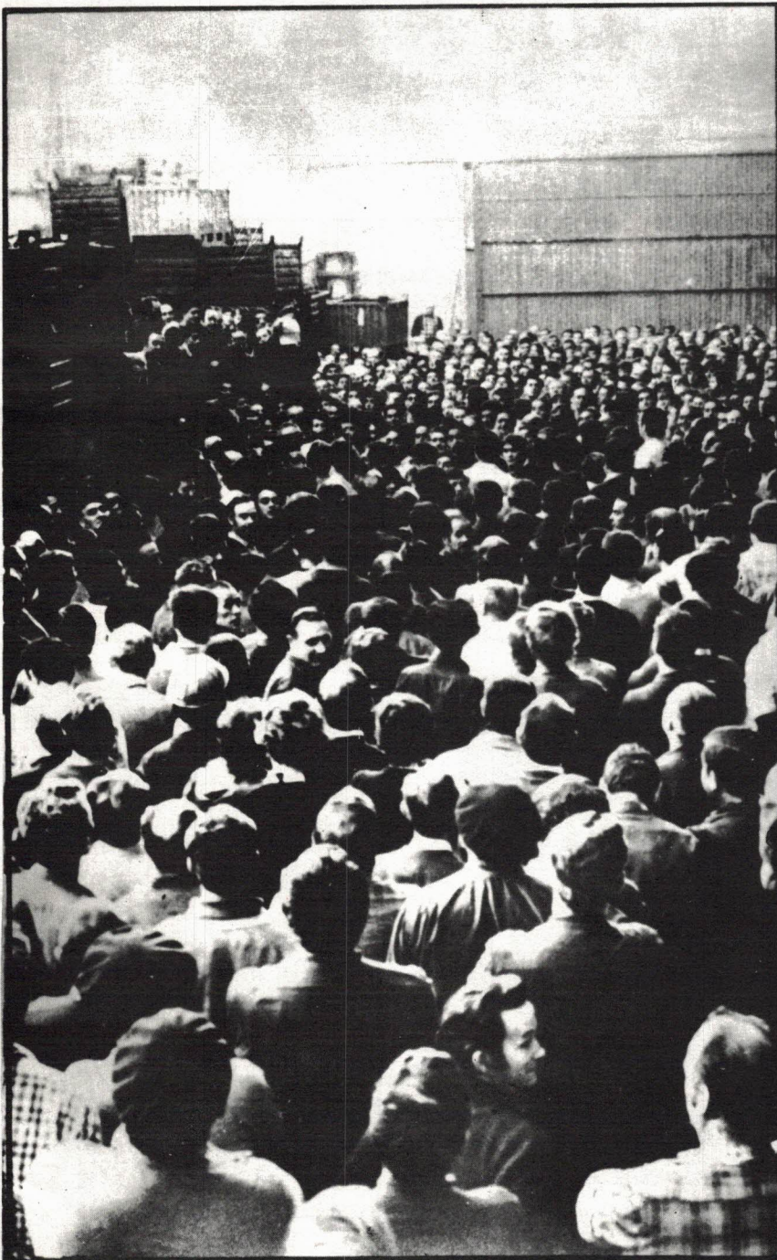
Aspecto de la asamblea de trabajadores de "V. Luzuriaga" de Pasajes. Momentos después de tomarse esta instantánea entró la policía disparando. Hubo varios heridos.

UNA BATALLA GANADA CONTRA LA REFORMA NEOFRANQUISTA DE SUAREZ: COORDINACION DEMOCRATICA RECHAZA LA CONVOCATORIA DE REFERENDUM Y ELECCIONES