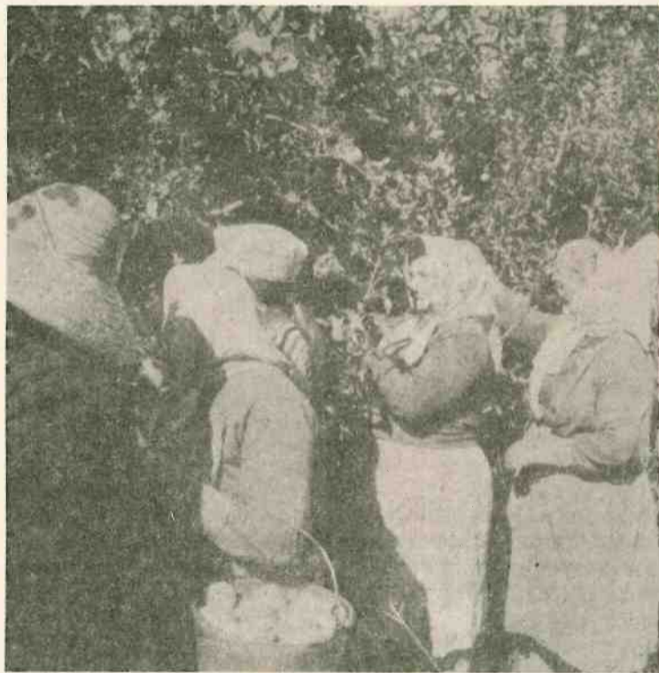
Recogedores y recogedoras de la naranja; muchos de ellos son pequeños campesinos.

La Redacción de Servir al Pueblo en Sevilla.