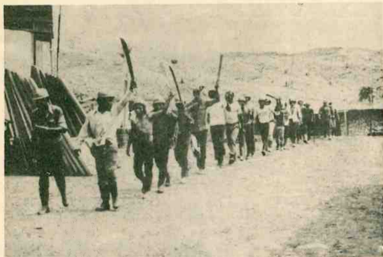
«Hombre de cara al viento», de Pedro Rivera.

Hay también la otra vertiente del Festival, la del público. Pese a estar financiada esta semana por el pueblo de Huelva, con fondos procedentes de las arcas de la Diputación y el Ayuntamiento, se hizo totalmente de espaldas a él. A las horas de proyección, a partir de las 9h. y las 16 h. en días laborales (razón por la cual sólo pudo ir un tipo de público muy particular) se viene a unir el elevado costo de las entradas, que restringe aún más, si cabe, la clase de público asistente. Esto choca más aún si se tiene en cuenta el tipo de cine que se lleva al festival—cine-militante y cine-denuncia, en su mayor parte—, y el público para quien se proyecta—burguesía y minorías intelectualizadas—. Y es que existe una diferencia fundamental entre hacer una Semana de Cine en Huelva o hacer una Semana de Cine para Huelva.