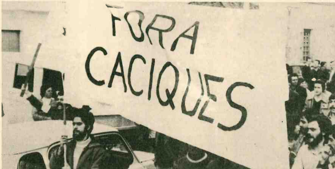
Los caciques gallegos y las altas esferas de la Administración, no dudan en utilizar el crimen organizado.