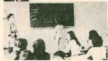
Campaña por la enseñanza religiosa