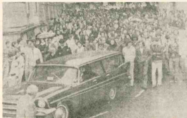
Miles de tinerfeños en el entierro en Las Palmas.

Al día siguiente, la ciudad amanece tomada por más de 800 antidisturbios procedentes de Córdoba y Zaragoza. El martes es un peligro transitar por las calles. Todo portador de señales de luto es apaleado; la policía detiene a los coches, golpea a sus ocupantes, destroza los parabrisas... Los grises obligan a los transeúntes, pistola en mano, a retirar las barricadas. El funeral, convocado en la Catedral,