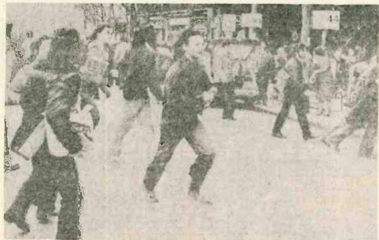
Estudiantes madrileños dispersados por la policía.

Así entre el paro, la miseria que afecta ya a muchos miles de familias, el abandono y la represión como única medicina aplicada por el Gobierno, en el País Canario crece la indignación, la conciencia de la necesidad de luchar por una autonomía que lleve el símbolo de la libertad y la justicia para los oprimidos.