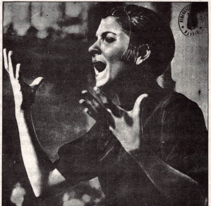
En los primeros meses de la guerra se llamó a las mujeres a las primeras filas de la lucha.

● Una de las cuestiones más difíciles y menos tratadas por los partidos revolucionarios es la contradicción que enfrenta a todas las mujeres con todos los hombres, a lo largo de toda la historia de nuestra opresión. Creemos que es pecar de idealismo el pensar que la opresión de las mujeres no está también sustentada por unos determinados privilegios adquiridos por parte de