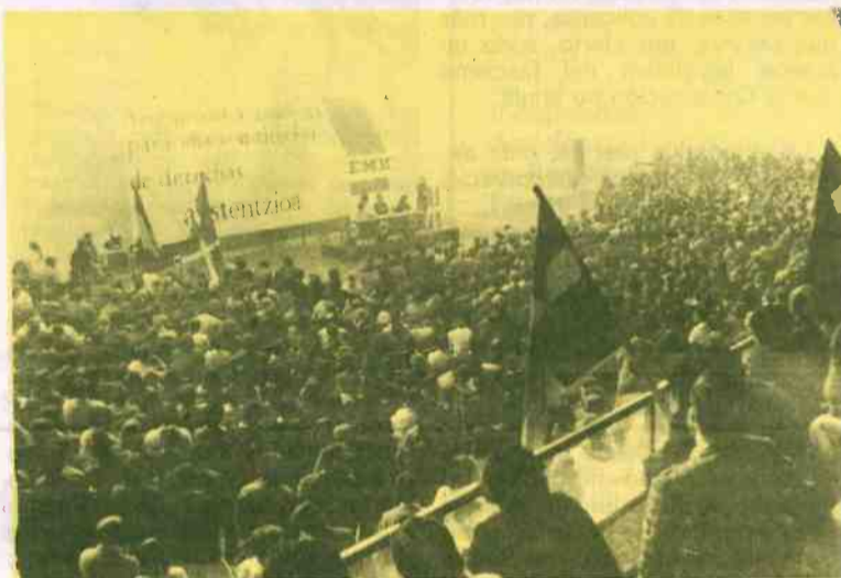
Aspecto parcial del mitin de Sestao

lo nuestros carteles— con afán digno de mejor causa.