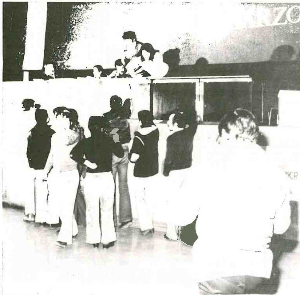
Se procede al recuento de votos para el reglamento del Congreso