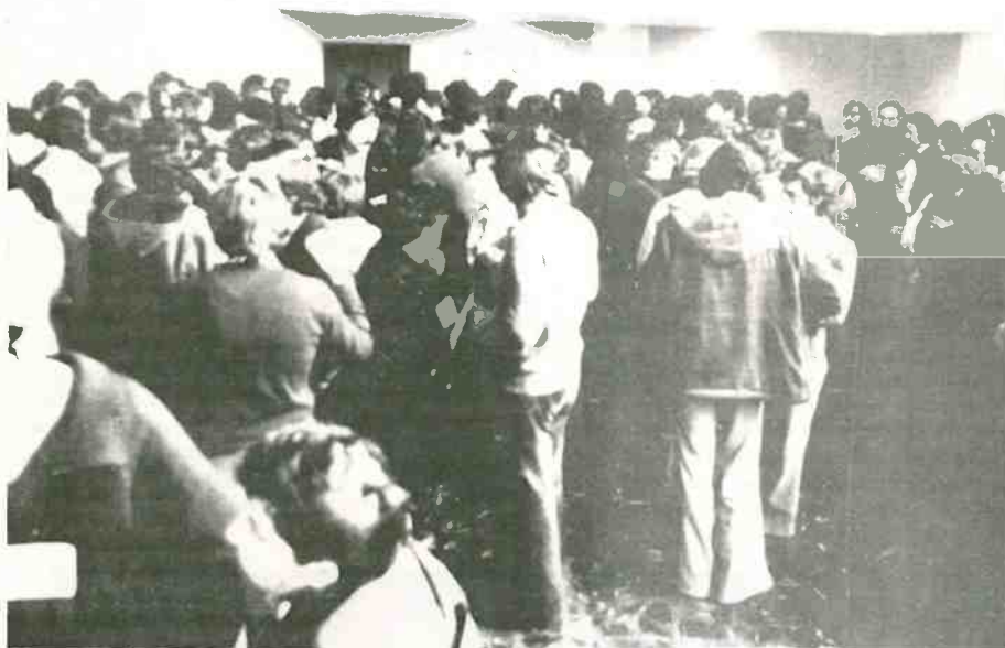
Un descanso en los trabajos.

Grau y García Ripalda, subrayando que "este gesto no es sólo un homenaje a estos militantes del Partido que han caído asesinados por el fascismo; es también la representación palpable de que nuestra lucha es una lucha a muerte".