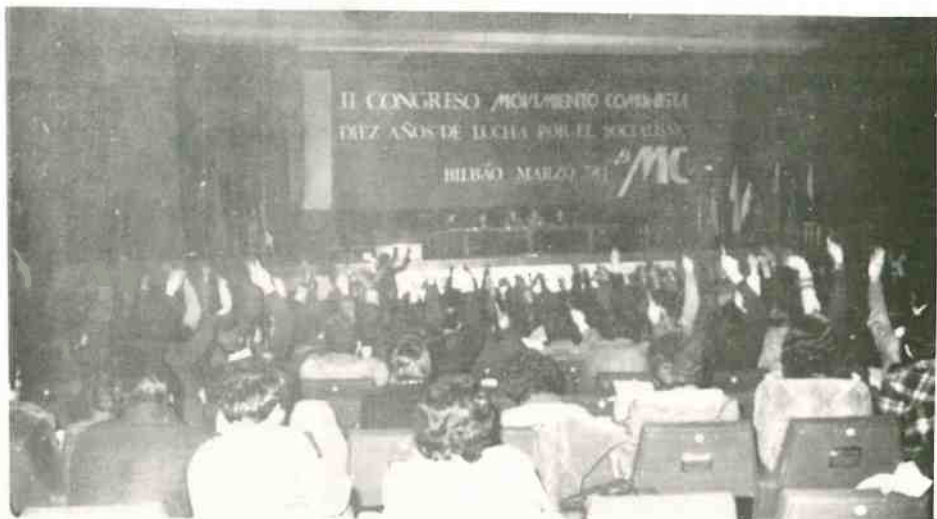
Una votación. En último término, los invitados, con derecho a voz pero no a voto.