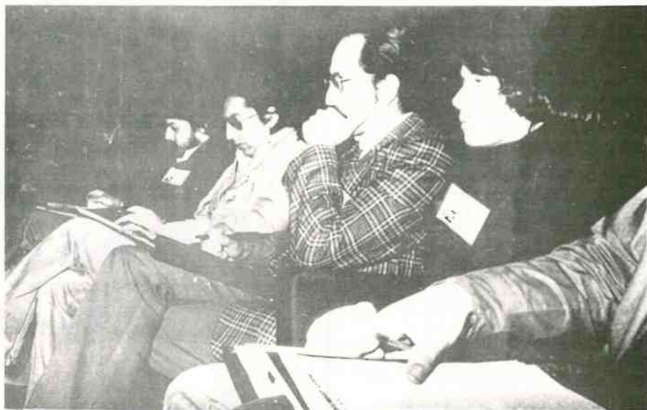
Delegados extranjeros siguen con atención la marcha de los trabajos del Congreso.

La ardua labor de estas comisiones ocupó largamente el tiempo de trabajo de la tarde, reiniciándose las sesiones plenarias hoy jueves, a las nueve de la mañana.