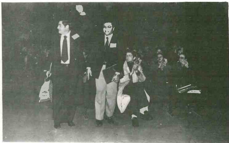
Aldo Moro ha impedido su presencia en el Congreso. Ello no impide que, como nos

Finalmente hemos recibido dos adhesiones a los trabajos del Congreso. El Partido Unitá Proletaria per il Comunismo (PdUP) ha enviado una carta dirigida a la presidencia del Congreso saludándonos calurosamente y deseándonos éxito en nuestro trabajo. Nos comunican que la difícil situación creada en Italia con el secuestro de