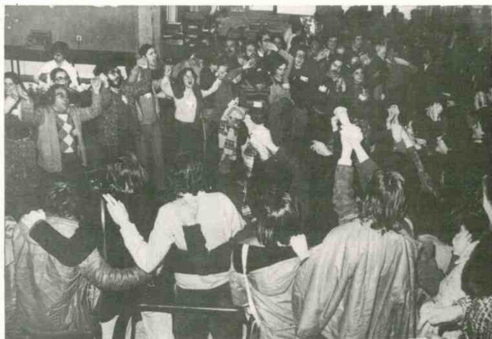
“...veremos una tierra que ponga libertad”

Finalizó la sesión de ayer, a propuesta de uno de los congresistas con los aires de la Internacional , cantada por todo el pleno puesto en pie puño en alto.