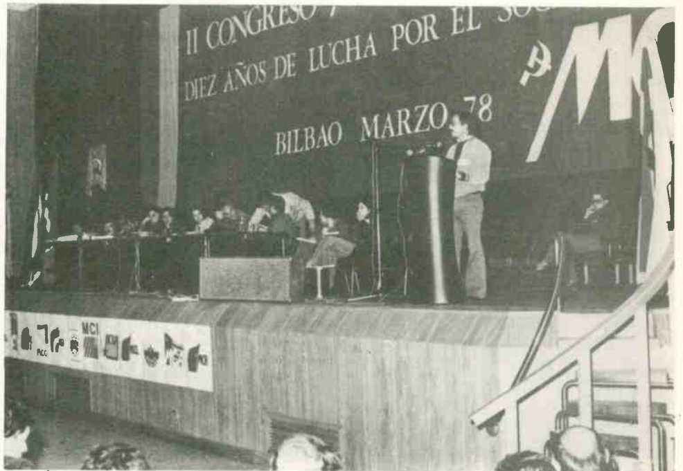
Un momento de los debates

principios leninistas de organización interna, y define su ideología como la del marxismo-leninismo enriquecido por las aportaciones del pensamiento de Mao Tsetung.