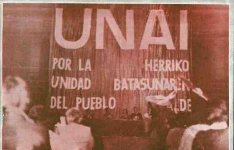
UNAI ha desarrollado una campaña de charlas y mitines por toda Navarra