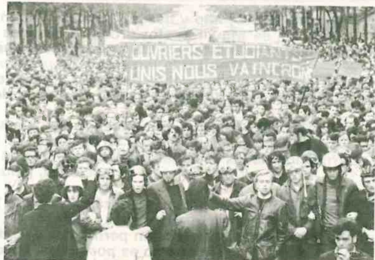
Lunes 13 de mayo del 68. Medio millón de obreros y estudiantes se manifiestan durante seis horas por las calles de París

(1) Estribillo de una famosa canción de la época posterior a la Comuna titulada "La Semaine Sanglante": "Versaillés, versaillés: / vous avez fusillé / le coeur d'une révolution, / mais il reste à Paris / l'esprit des insurgés".