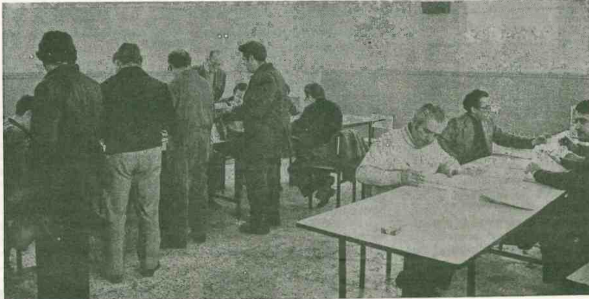
Los derechos sindicales de los trabajadores, atacados por los empresarios

Pues señor, en esto llegan los empresarios, anuncian poco menos que el fin del mundo capitalista, tocan a rebato y convocan a sus huestes a santa cruzada.