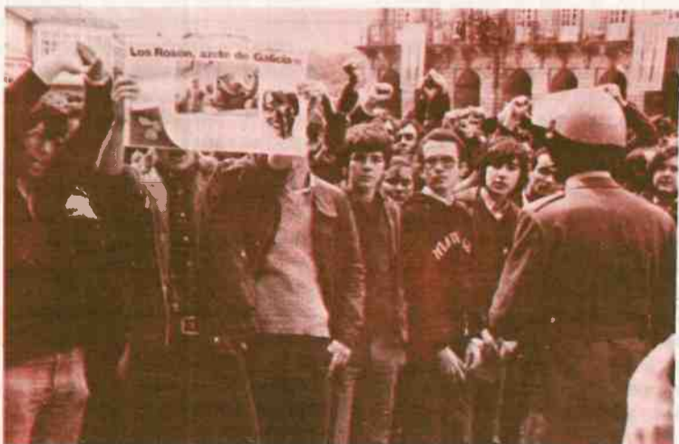
Rosón azotando ahora a Galicia desde la presidencia de la Xunta

El mitin terminó con los cantos de la Internacional y el "Eusko Gudariak..."