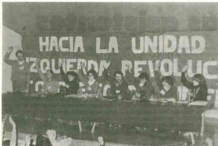
Aspecto del Congreso previo del MC

los portavoces de ambos Congresos expusieron las conclusiones a las que habían llegado por la mañana los y las militantes de ambos partidos. Inmediatamente después, y por unanimidad, quedaron aprobadas las Bases para la Unificación del MC y la OIC.