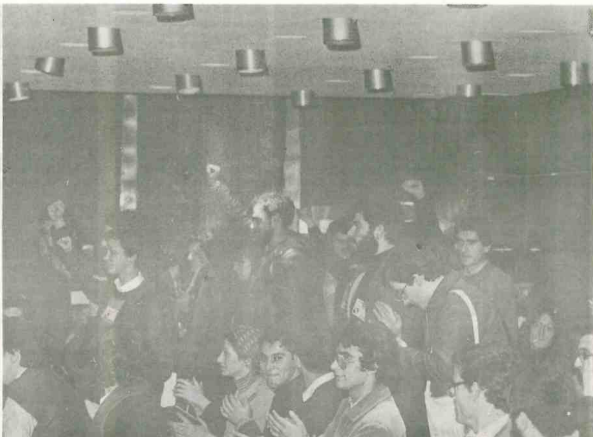
Los delegados y delegadas a la Conferencia de Juventudes saludan al Congreso