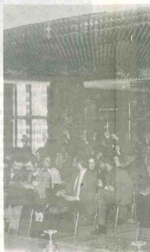
El voto unánime del Congreso de la

los porta sos expu las que t ña los partidos. pués, y p aprobada ficación