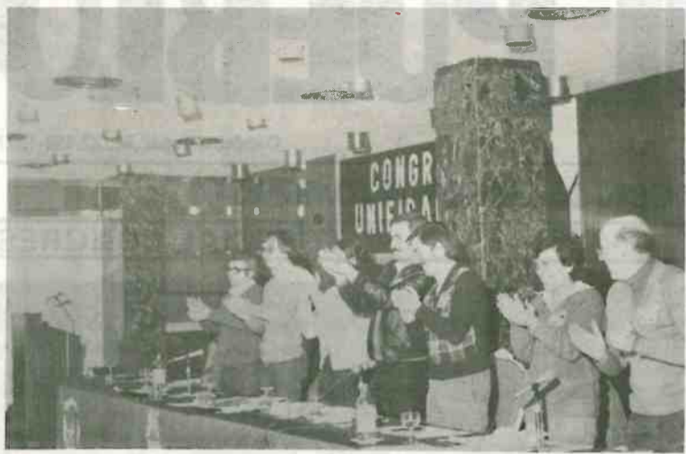
Aspecto del Congreso previo de la OIC

La sesión de la tarde había sido precedida por los Congresos (por separado) de ambos Partidos. El Movimiento Comunista lo celebró en el Colegio Mayor Universitario —ironías de la vida— Isabel de España. La OIC, en el propio Eurobuilding, que sería después escenario del Congreso de Unificación. En los dos Congresos, los y las representantes de los dos Partidos aprobaron el reglamento del Congreso y acordaron formalmente llevar a cabo la unificación de ambos partidos en la manera expuesta en el documento anteriormente mencionado.