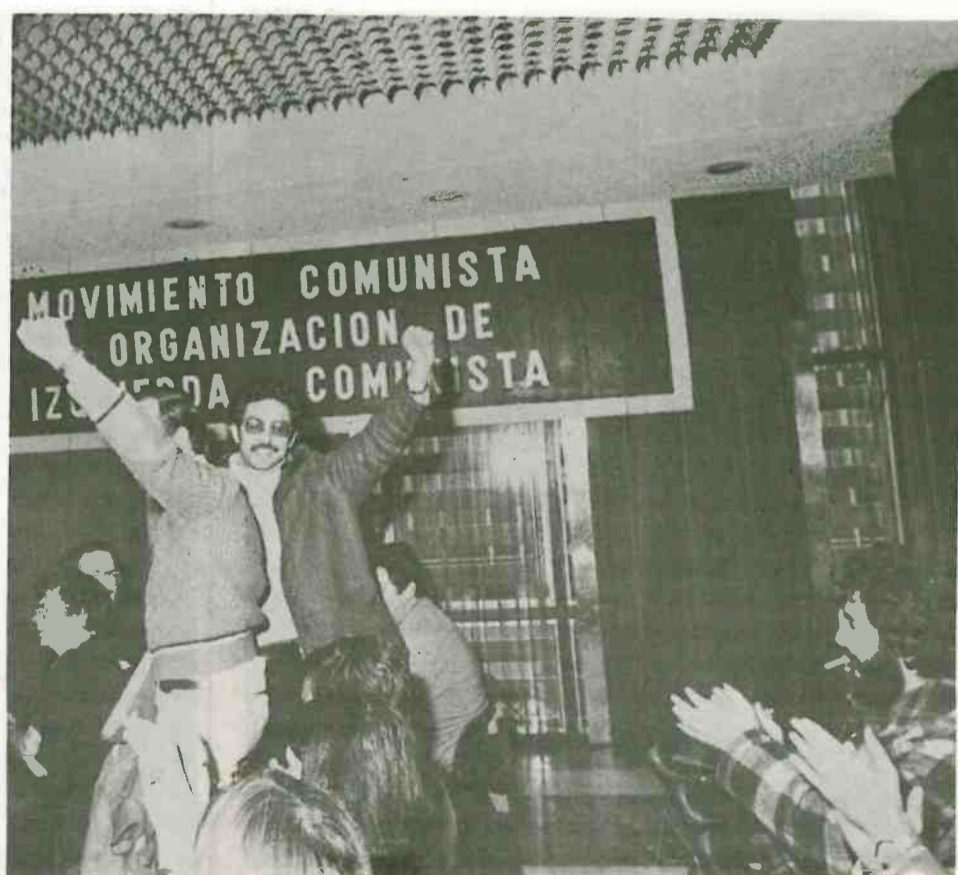
Las diversas delegaciones extranjeras — cuatro de las cuales muestran las fotos — fueron saludadas calurosamente por el Congreso