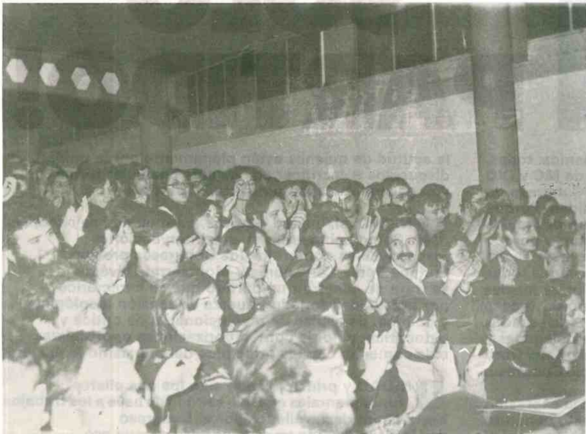
El Congreso del MC saludó la aprobación de las bases de fusión con una cerrada ovación

las delegaciones de los partidos y organizaciones extranjeras amigas presentes en nuestro Congreso. Inmediatamente se procedió a la aprobación del Reglamento del Congreso. Tras la ratificación de la Mesa del Congreso —compuesta por la suma de las Mesas de los Congresos de MC y de la OIC—,