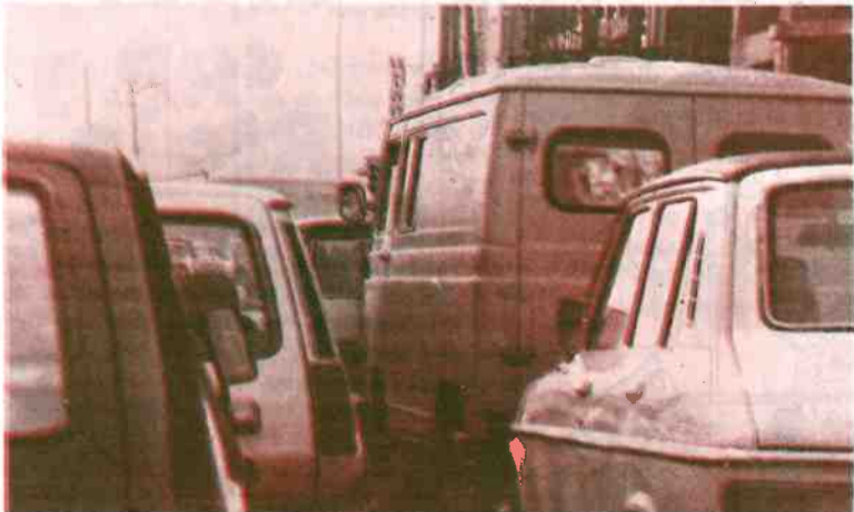
El atasco de cada día

Si lo: OIC lleg Bilbao, lítica firmamient gran ca legislaci obligue petar el que des es más cación legislaci mas de agua, obligatc basuras estricto contam dustriás