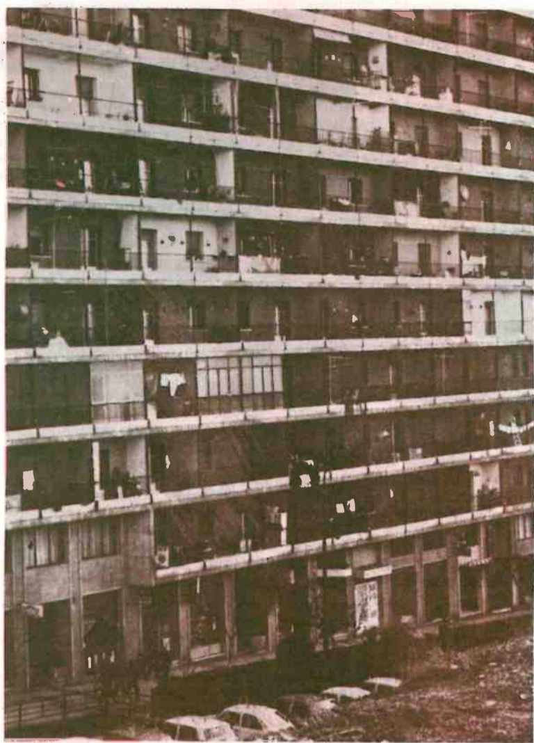
Hay que acabar con las colmenas humanas

Medidas urgentes tales co- mo la reforma del Plan Metro politano, la puesta en marcha de un plan especial de equip- amiento para los barrios, la pro- moción pública de viviendas de alquiler, la municipalización de las actuales viviendas de alquiler de protección oficial, la remodelación de los barrios antiguos o prematuramente