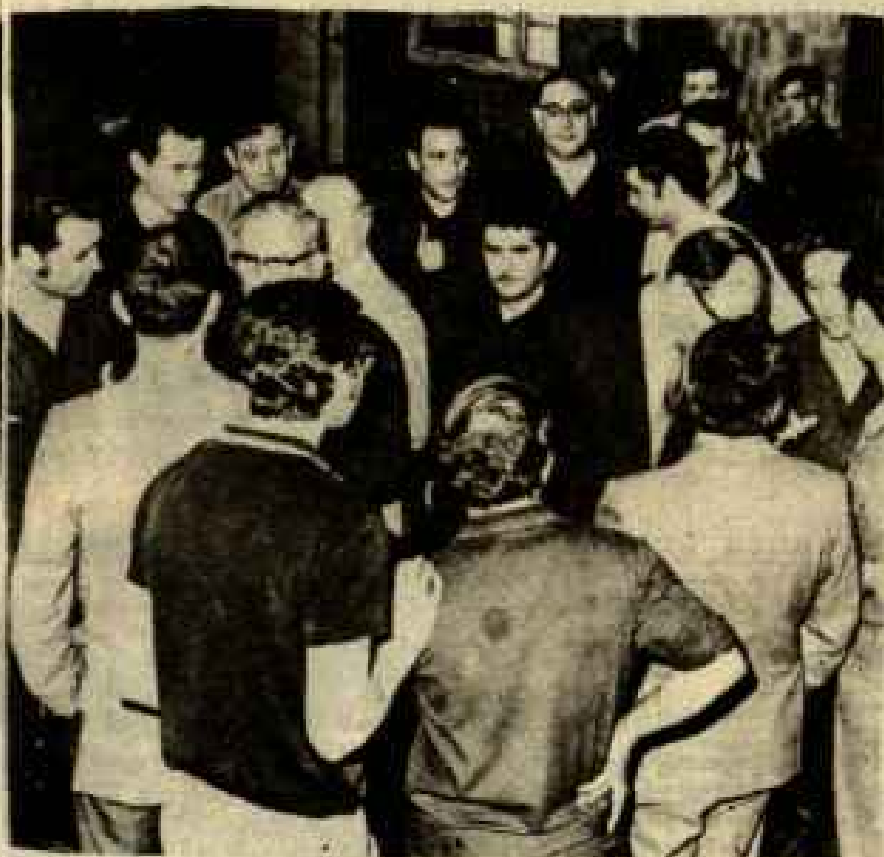
● La Asamblea marco de discusión

Mas ¿ qué ocurrió en 1.975?. En el seno del aparato negociador CNS las cosas habían cambiado: las candidaturas "Unitarias y Democráticas" habían sustituido en la mayoría de los bancos a los inoperantes "verticalistas", ello suponía un reforzamiento importante de aquel organismo que queremos derribar: la CNS, la cual, a partir de las UTT de Banca, se nutría de aquellos hombres que habían adquirido la representatividad de sus compañeros de empresa.