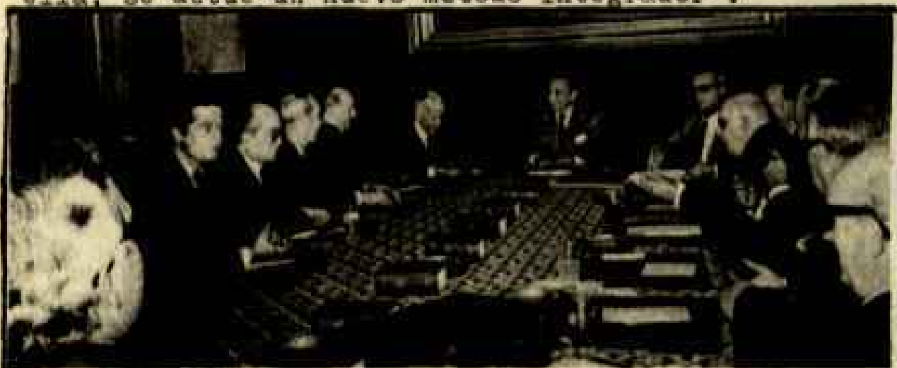
BOPLARON BRUMAS DEL NORTE

La época conocida como "autarquía" desaparece, y con ella los artificios que la posibilitaron: Los Falangistas. Su lugar es ocupado por los tecnócratas del Opus Dei, (Lopez Bravo y cia.) . Estos saben que la inflación es el mecanismo que han empleado todos los países capitalistas para mantener una desigual distribución de rentas entre clases sociales solo que ahora, ya no es posible activar este mecanismo a través de la "mano dura" y el paternalismo. Los tecnócratas del Opus Dei aprendieron de sus colegas Americanos, Ingleses y Alemanes que la dureza represiva, a la larga, no hace más que avivar la necesidad sentida de luchar de un modo más radical contra el sistema de explotación. Ellos prevén el conflicto a largo plazo y consideran que, frente a la creciente conflictividad que presenta la clase trabajadora en España, la "mano dura" no es suficiente, en según que condiciones puede actuar incluso de revulsivo, sin abandonarla en ningún momento, es preciso que, junto a ella, se actúe un nuevo método integrador .