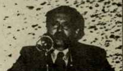
NABERAZALLUZ, ANUNCIANDO A LOS OBREROS QUE LUCHAN POR AUMENTAR SUS SALARIOS

(palabras del PNV en el mitin de Añoeta en Donosti el 5-12-76. Ci- ta sacada de la Hoja del Lunes - de San Sebastián 6-12-76)