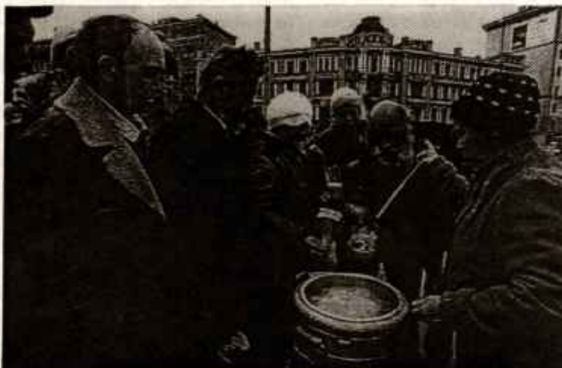
Ciudadanos en las calles de Moscú

Y lo más espeluznante de todo, el 90% de los escolares sufre algún tipo de trastorno patológico o una enfermedad crónica. ♦