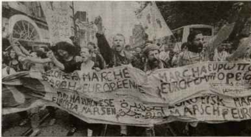
Aspecto de la cumbre alternativa. La manifestación.

3 0.000 personas provenientes de toda Europa exigieron el pasado sábado 14 de junio una Europa que considere la dimensión social entre su estrategia de unificación, protestando en el centro de Amsterdam contra la pobreza, el desempleo y el conjunto de la política social y laboral de la U.E.