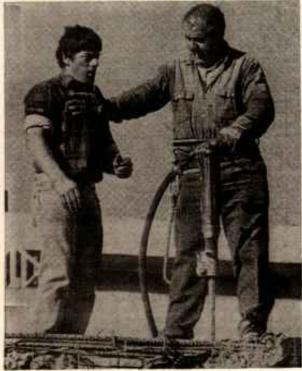
La Construcción es el sector donde más accidentes se han producido este verano

Pero ya sabemos que la foto resumen del verano oficial será el rostro de la familia real desde el palacio de Marivent en Palma de Mallorca, después de haber descansado en sus veleeros de todo un año sin dar un palo al agua. ♦