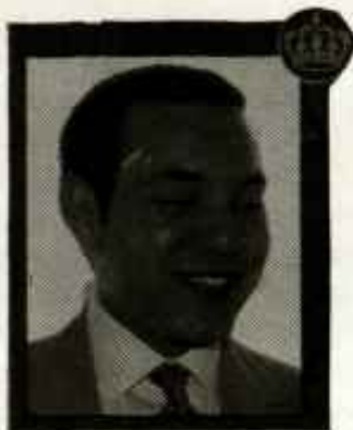
EL PRINCIPE SIDI MOHAMED VÁSTAGO DE LA PESADILLA