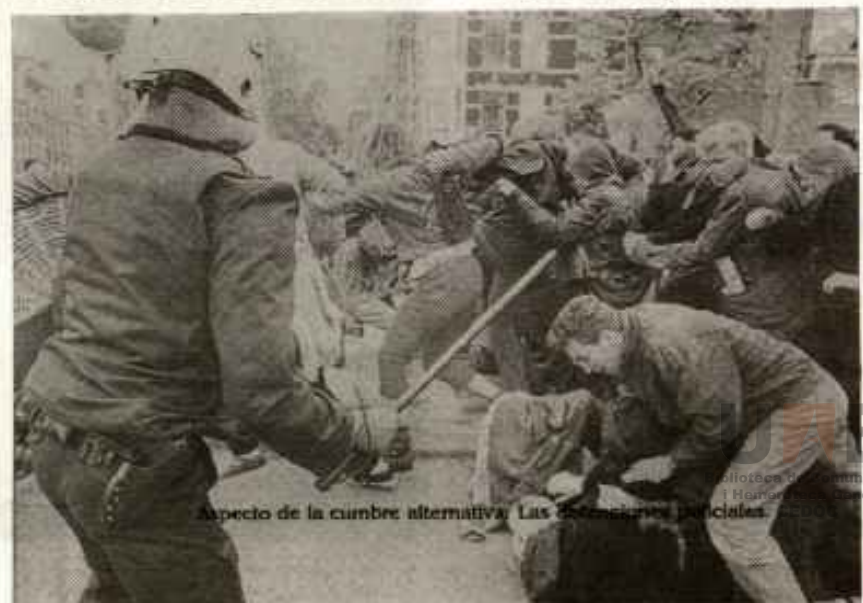
Aspecto de la cumbre alternativa. Las detenciones policíacas.

Para concluir, reflejar que la policía, ¡buenos perros de sus amos!, cargó contra los manifestantes en algunos tramos y que protegió eficazmente a los Jefes de Estado, Gobierno y Ministro concentrados, los cuales pudieron desarrollar sus comidas, cenas, brindis y declaraciones, sin que los ecos de la calle turbasen sus tranquilas conciencias de probos dirigentes. ♦