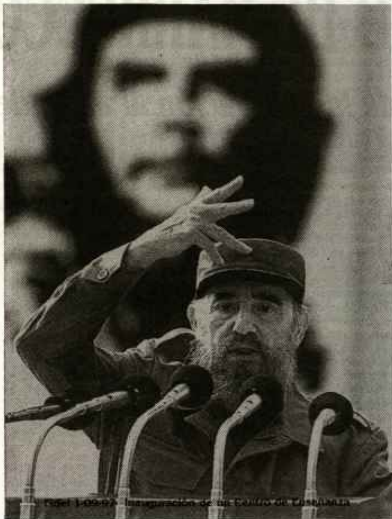
Fidel Castro. Inauguración de un edificio de Cuba.

E l 27 de agosto la extrema derecha afincada en Miami dió rienda suelta a su más recurrente frustración: Fidel Castro había muerto. Su sueño más largamente incubado, por fin se había cumplido. El rumor originado en los medios de prensa hispanos de la capital de Florida, se propaló por todo el mundo y particularmente entre la comunidad de exiliados cubanos en EE.UU. Pero pronto tuvieron que despertarse de su dislate onírico. La realidad desvaneció su duermelva gozoso. Fidel vive y lo que es peor para ellos, el pueblo cubano está dispuesto a seguir el camino de liberación iniciado en Sierra Maes-