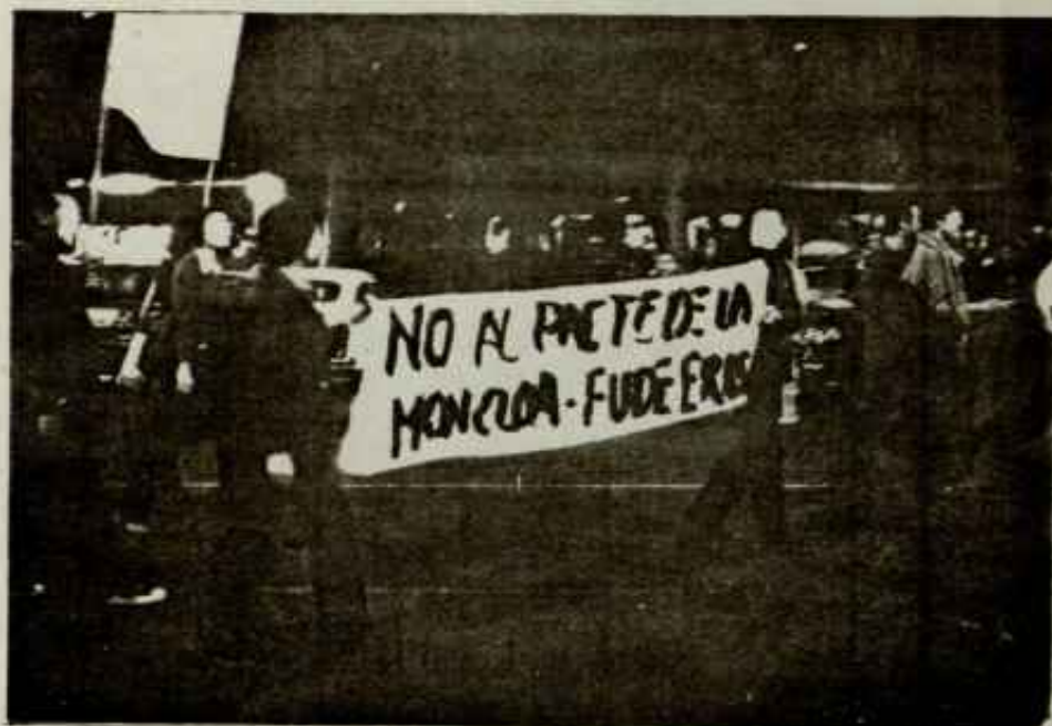
La FUDE en contra del pacto de la Moncloa en la manifestación del viernes 11 a las 7,30 de la tarde.

la gran patronal quiere que siga vigente dentro de las fábricas el orden laboral de los últimos 40 años. lo que significa que quiere dismantelar todo el movimiento asambleario, picuetes de trabajadores, etc.. Para ello cuentan con la colaboración especialísima de unos sindicatos amarillos en su comportamiento como son CCOO, UGT, "Unitarios", etc..