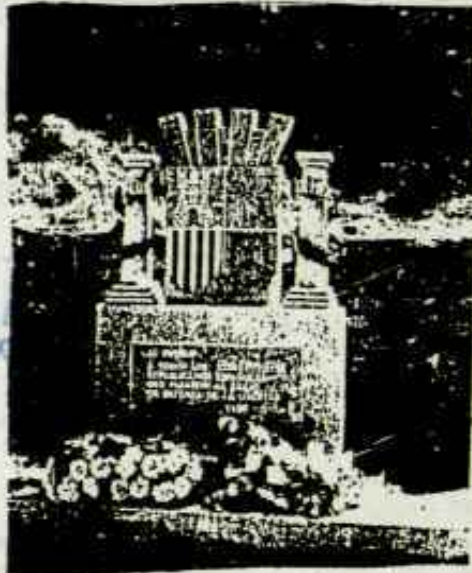
Les Illes - Monument a la Memòria del 50 aniversari de l'exili republicà espanyol a França.

a Montjuïc. Quan, l'any 1940, les forces militars alemanyes ocuparen França, la policia de Franco tingué les mans lliures per entrar en territori francès i capturar els dirigents republicans espanyols, bascos i catalans. En foren víctimes Lluís Companys, Julian Zugazagoitia