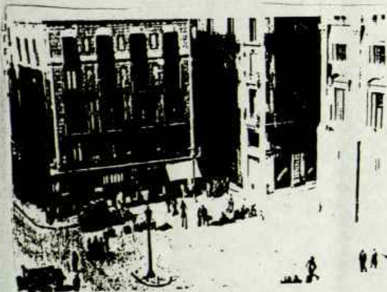
Barcelona. La Plaça de la República l'endemà del 6 d'Octubre 1934.