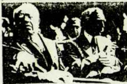
Manuel Azaña i Francesc Macià : Homes símbol de la República

Es que els valors genuïns i històrics del poble sorgeixen del fons de l'ànima popular?