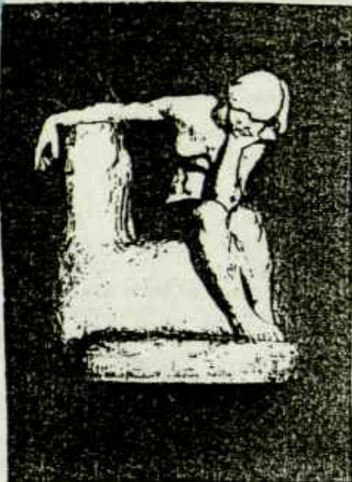
JOSEP LLIMONA, MEDITACIÓ De "CATALÒNIA"

D'ençà d'aquella data, els catalans defensen llurs llibertats nacionals, llur cultura i llur llengua.