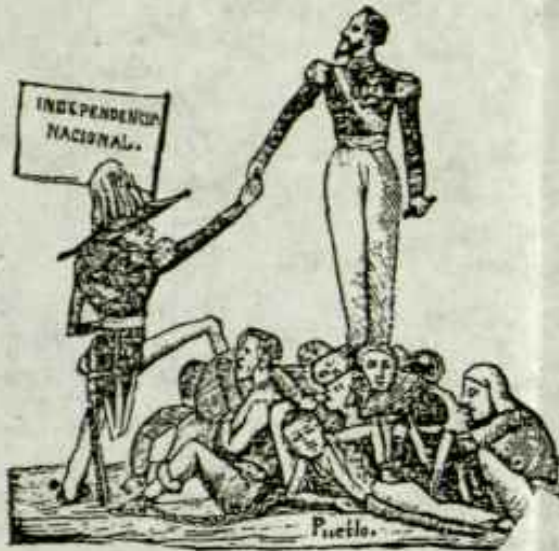
"El Republicano" - 1842

En l'Espanya post-franquista no ha una estranya llibertat: a Catalunya es pot ser avui dia anti-espanyol, independentista, però no vul-