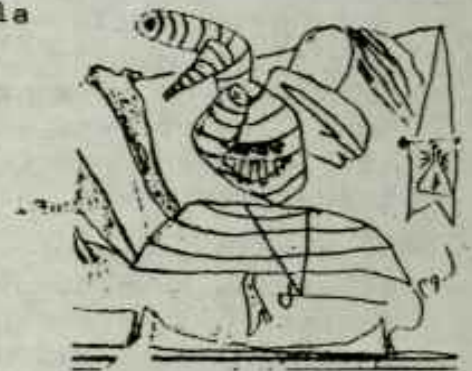
Picasso : "Somni i mentida de Franco"

La nova República haurà de fonamentar-se en la solució del problema de les nacionalitats.