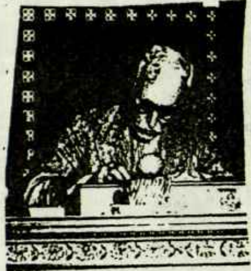
Francesc Macià signa l'acte de proclamació de la REPÚBLICA CATALANA

Avui dia ens trobem també amb guerres d'independència nacional que són contrarevolucionàries. Ho va ser la guerra de l'Afganistan